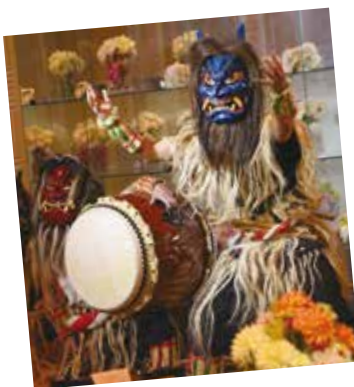
▲なまはげ太鼓を披露