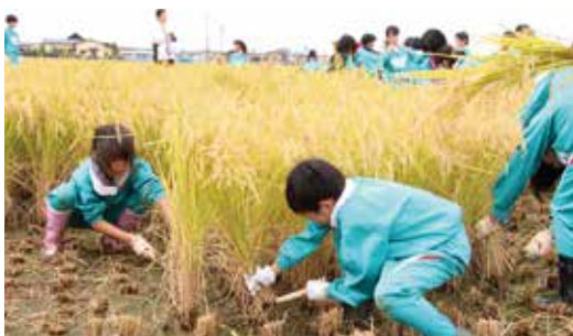
▲稲刈り体験する生徒(外旭川小学校)