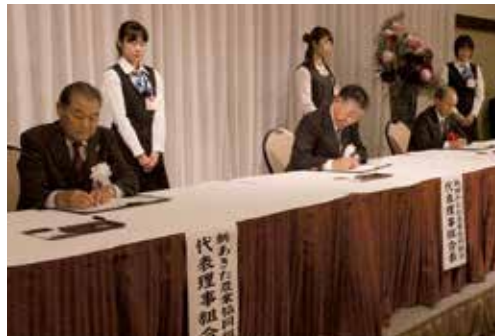
▲合併契約書に調印する(左から)京極組合長、吉田組合長、船木会長