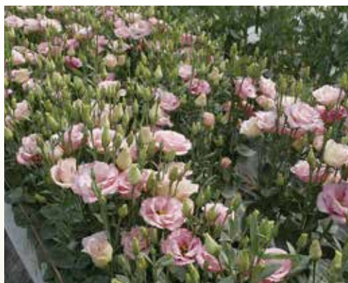
出荷直前のコレノローサ

定経営を目指しています。花の品種は過去の栽培経験から3〜6品種に絞り込んでいます。土づくりを重要と考え、収穫が終わってからは土壌診断を行っています。土壌の状態を正確に把握することで、効果的かつ効率的な肥料設計ができ花に合った土づくりを目指しています。花のコンディションは毎日観察し、温度管理やかん水方法、施肥や防除など状況を想定しての適期判断をして管理作業をしています。夏のハウス内は温度が高く作業がづらい時もあります。が、忙しい中にも充実感に満ちて働くことが出来ています。き