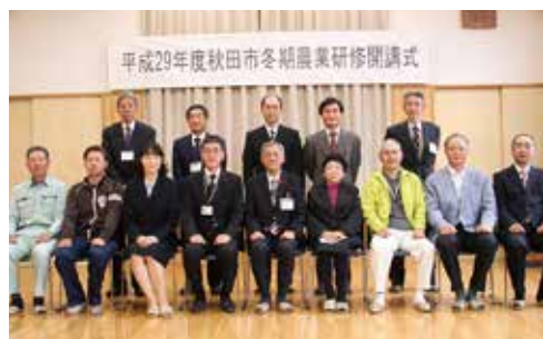
▲これから半年間の研修をともしする受講生と講師(秋田市園芸振興センター)