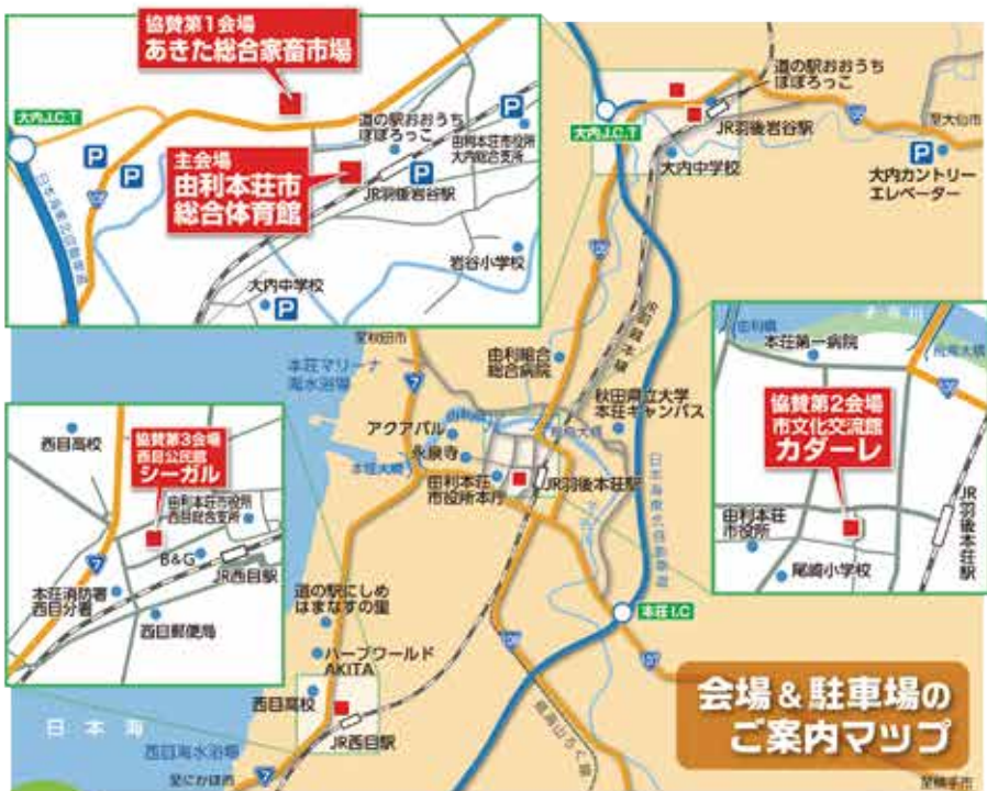
会場 & 駐車場の ご案内マップ

※主会場、協賛第1会場と駐車場をつなぐシャトルバス(無料)を運行いたしますのでご利用下さい。