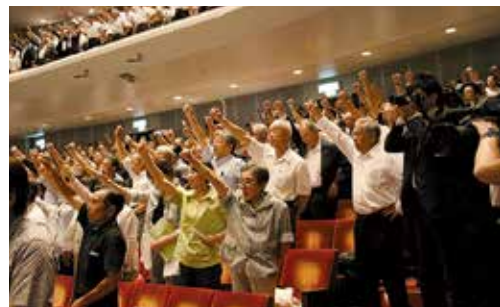
▲ガンバロー三唱をする参加者(秋田市文化会館)