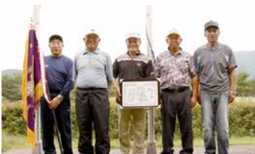
▲団体の部で優勝した上新城Aチーム(太平山リゾート公園)

今大会の団体上位3チームは、10月17日(火)に行われる第5回JAバンクあきた主催の全県大会に出場する予定です。