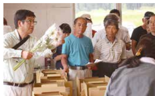
▲JA職員の説明を聞く生産者(園芸集出荷施設)

目揃会終了後、部会では、より高い品質を維持するために、MPSジャパン株式会社「花き日持ち品質管理認証制度」生産部門認証取得に向けた説明会を開きました。