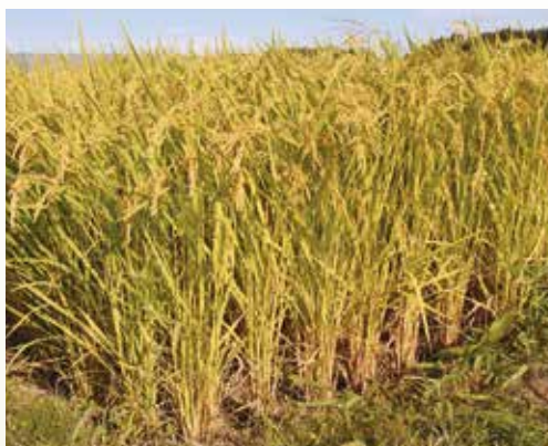
順調に生育中のあきたこまち

栽培技術は特別なことはやっておらず、基本に忠実な稲作づくりに徹底しています。ほ場条件などもあり高収量は難しい地区だと思っていますが、新技術