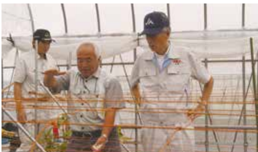
▲説明を受ける長澤会長(右)((農)平沢ファーム)