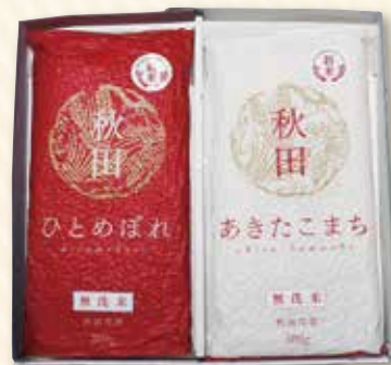
平成28年度「地域限定米」

を設定し、加算を行います。また「新あきたプレミアム米」として販売を予定しております。