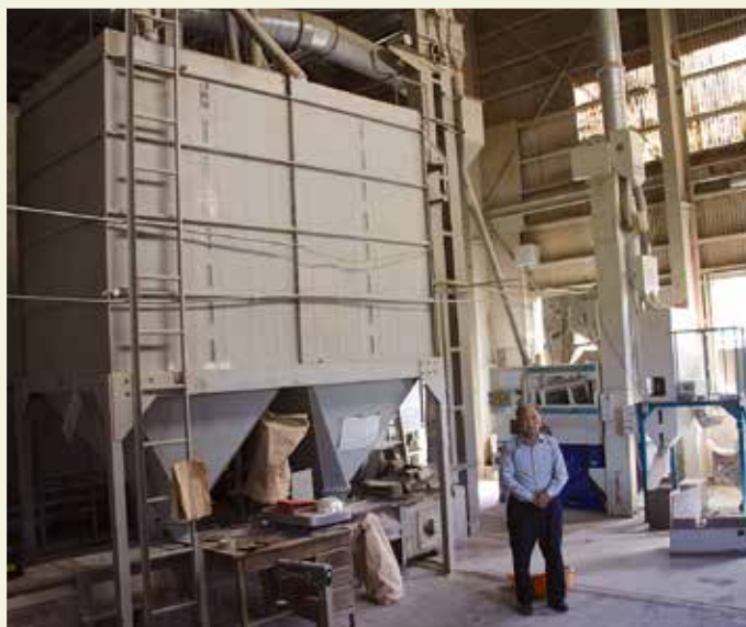
ライスセンター施設

高齢化、担い手不足、耕作放棄地の問題など地域農業の課題は山積みですが、農地を守り、地域農業を守っていきます。