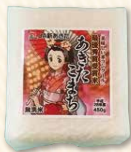
平成28年度「美味しいお米コンクール」最優秀賞受賞米