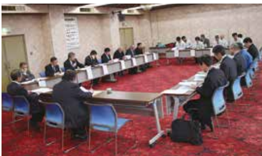
▲安全・安心について意見を出し合う協議委員(JA新あきた会館)