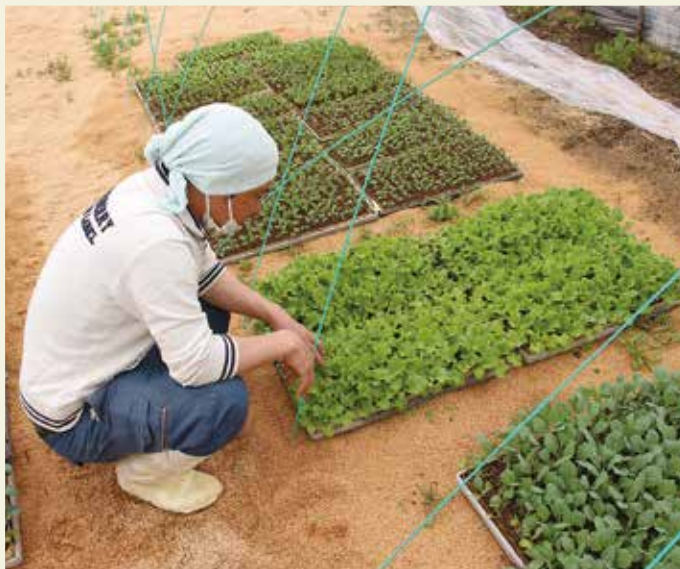
レタスの生育を確認