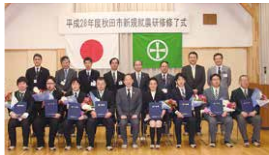
▲2年間の研修を終えた研修生と関係者(秋田市園芸振興センター)