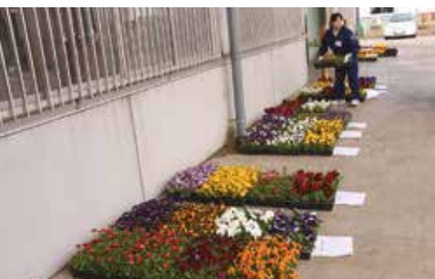
▲鮮やかな色の花が並ぶ(四ツ小屋低温倉庫前)