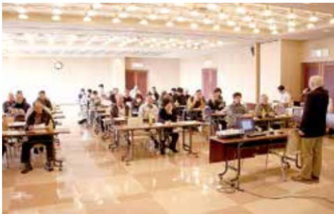
▲話に耳を傾ける部会員(河辺支店)

また、営農センターが枝豆共選料について、枝豆機械設置計画について、作付予定面積の説明をしました。平成29年度目標面積は55ha、販売額1億円を目指します。