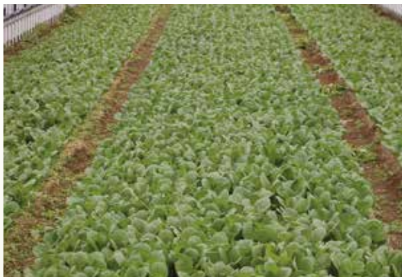
出荷直前の小松菜

取り扱うことで収入を含めて安定した農業経営になると考えています。ブロッコリー、カリフラワーなどは一日ごとに成長する野菜なので、収穫のタイミングは気を使います。良い野菜を早く消費者に届けたいと思いつながら作業をしています。栽培技術では雑草対策や排水対策、病害虫防除など基本的なことをきっちり行っていますが失敗はつきものです。常にほ場を観察し原因を突き止め次の栽培に活かすように心がけています。良い野菜が売れた時には農業にやりがいや達成感を感じています。