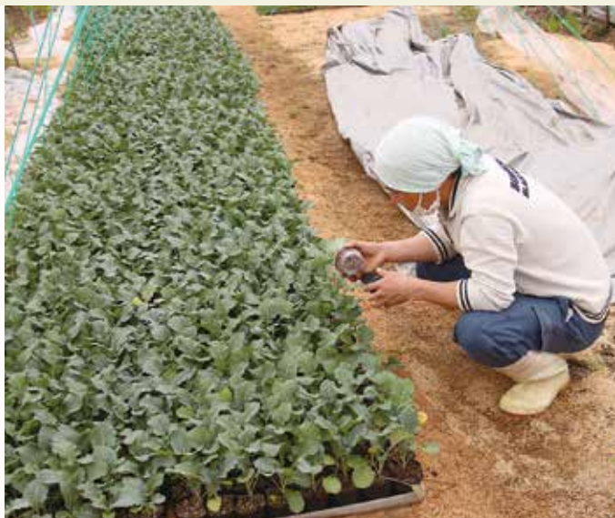
ブロッコリーの生育を確認