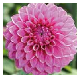
【ミッチャン】 大型、ピンク

ダリア栽培にチャレンジしてみたい方は、営農センターへお問い合わせ下さい!! 018-833-5053