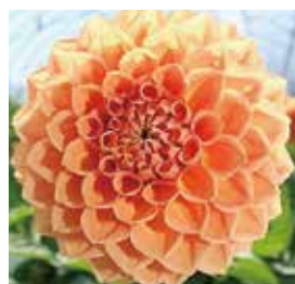
【ハミルトンジュニア】 中輪、オレンジ