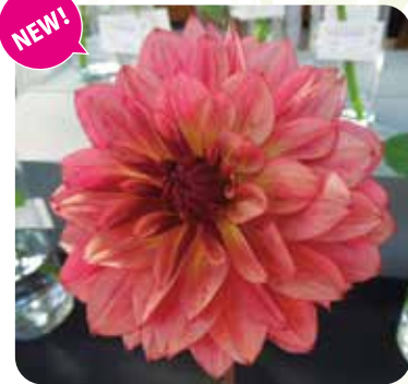
NAMAHAJEオープン:オープンとは英語の球・宝球・宝玉の意味(中輪)