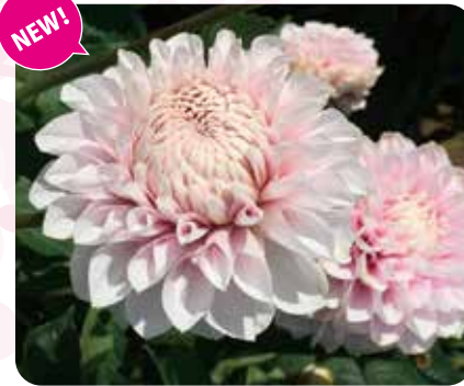
NAMAHAJEチーク:女性がチークを入れたイメージで名付けられた(中輪)

ネーミングは、「秋田を連想させ、ダリアの豪華さに負けず、一度聞いたら忘れられないインパクトのある名前」として「NAMAHAJE」が考案されました。