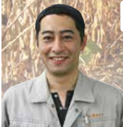
営農センター センター長補佐

「大豆の収穫時期が近づいてきました。 無理な作業をせず、 良質な大豆の生産を心がけましょう。」