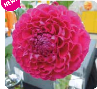
NAMAHAJEローズカップ:バラのカップを連想させる、鮮やかな蛍光ピンク(中輪)