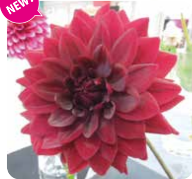
NAMAHAJEクリムゾン:深い赤色という意味を持つ(中大輪)

※平成24年から本年までにNAMAHAJEシリーズ21品種をデビューさせています。