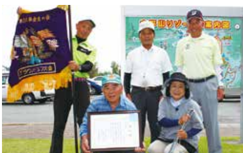
▲団体の部で優勝した河辺Aチーム(太平山リゾート公園)

今大会の団体上位3チームは、10月13日(木)に行われる第4回JAバンクあきた主催の全県大会に出場する予定です。