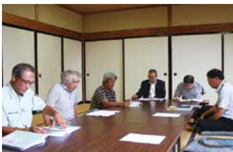
▲話に耳を傾ける会員(雄和サイクリングターミナル)