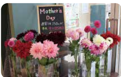
▲あぐりんなかいち

首都圏におけるダリア需要は年々高まり、一般消費者へも需要が拡大している中、JA新あきた産ダリアの品質評価は高く、出荷量拡大が望まれています。秋田県オリジナル品種「NAMAHAJEシリーズ」を中心に販促PRに努め、県内外市場でのシェア拡大を目指します。