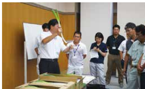
▲出荷の注意点を確認する(雄和支店)