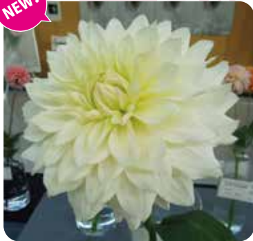
NAMAHAJEシフォン:シフォンケーキを連想させる柔らかな黄色と白のグラデーション(中大輪)