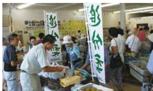
▲試食販売を行う部会長(ファーマーズマーケット彩菜館)

購入しやすい2玉入りのパックと、14玉入り箱の2種類を用意し、生産者の顔写真と追分梨の特徴を書いたポストカードをいっしょに渡し、お客様と会話しながら販売しました。