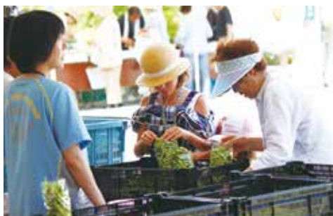
▲枝豆の詰め放題(河辺支店)

支店駐車場に特設テントを設置し、イベントを開催しました。営農では枝豆の詰め放題、共済ではアンパンマン記念撮影、金融ではポップコーンとJAバンクのCMでおなじみの「ちよリス」商品の抽選会を行いました。展示ブースとしては三交モーターズ様より軽自動車の展示販売、秋田石材様より相談会等を行いました。女性部からは新鮮朝採野菜の特売、JA新あきたライフサービスからは飲み物、果物の特売のほか、屋台も出店し、終日、多くのお客様で賑わいました。