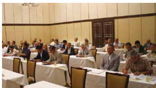
▲総代の皆様(秋田ビューホテル)