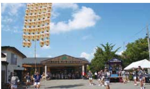
▲職員が竿燈を披露(デイサービス悠楽館)

施設内では、金魚すくい、射的、お菓子つかみどり、ビンゴゲーム大会などイベントを開催し全員で夏祭りを満喫しました。