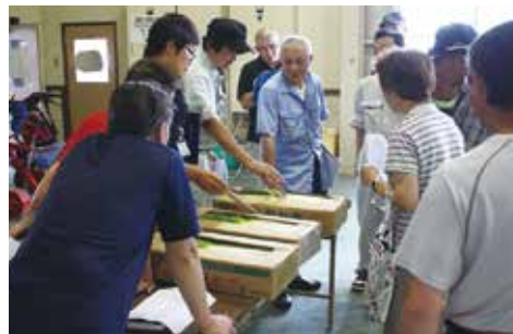
▲出荷基準を確認する生産者(追分グリーンセンター)