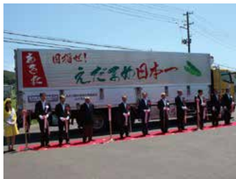
▲テープカットセレモニー