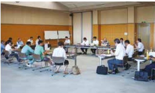
▲若手農業者(雄和支店)

新たに7月に稼働する最新の枝豆選別施設を視察研修した後、JA職員が司会進行し、秋田地区JA合併構想について、平成30年産米からの生産数量一律配分の見直しについて、JA農業振興計画、県及び市よりの情報提供がありました。