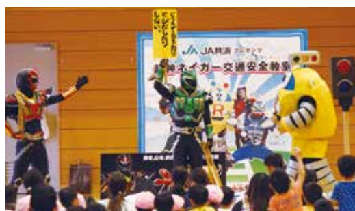
▲超神ネイガーと交通安全のルールを確認(秋田市北部市民サービスセンター)