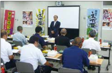
▲市場内の船木組合長(横浜中央卸売市場)

市場内では試食宣伝コーナーを設置し、ミスフレッシュ秋田の方もいっしょにPRしました。