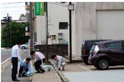
▲本店周辺の草を除去する職員(JA新あきた会館前)