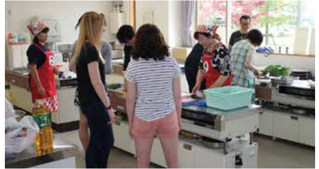
講師の説明を聞く留学生(河辺総合福祉交流センター)

完成後には、女性部が持ち寄った「ほしもち」「あざづけ」とあわせ試食会を開き、「おいしい」と言いながら交流を深めました。 今後このような活動を通じて伝統的な文化や技術を伝承していきます。