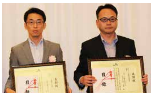
▲本店長 (秋田キャッスルホテル)