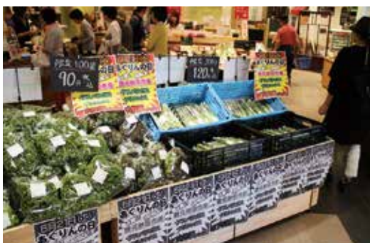
▲あぐりんの日(あぐりんなかないち)