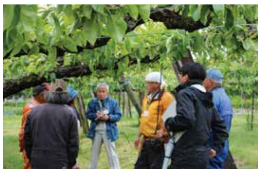
▲園地でナシの生育を確認する生産者ら(下新城・中野地区)

部会では、今後も園地巡回や技術研修会を積極的に行い、高品質な果実生産を目指そうと確認しました。