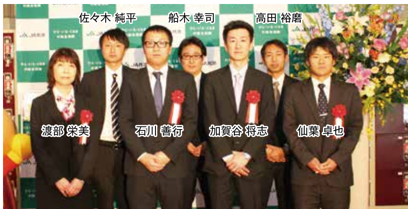
▲この度、表彰された支店・職員(秋田市文化会館)

平成28年度もこれまで以上に組合員・ご利用者の皆様のお役に立てるようサービス向上に努めてまいります。