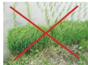
▲余り苗は水田内の泥に埋めて処分

移植時に箱粒剤や側条施用剤を使用していない水田では、オリゼメート粒剤を6月12日～18日までに2kg/10aを必ず散布しましょう。また、圃場に放置されている余り苗がかなり多く確認されています。余り苗は直ちに水田内の泥に埋めて処分してください。