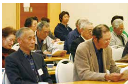
▲話に耳を傾ける会員(プラザクリプトン)