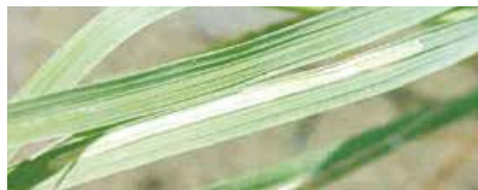
▲イネヒメハモグリバエの被害葉