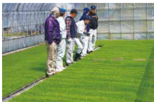
▲巡回し生育状況を確認する生産者とJA職員(追分地区)

今後も営農指導員は、管内の巡回や現地研修会などを通じて情報の発信をしていきます。