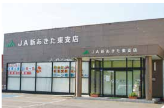
▲土曜日営業開始(東支店)

営業時間は毎週土曜日午前9時～午後3時(お盆期間・年末年始は除く) 営業範囲は金融・共済にかかる相談・申込・契約等