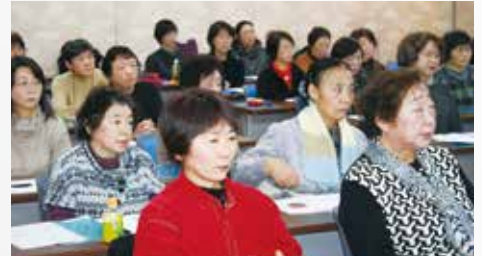
▲講師の話に聞き入る部員ら(新あきた会館)