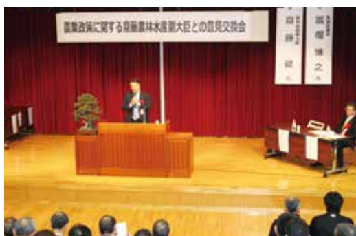
▲活発に行われた意見交換会(雄和市民サービスセンター)