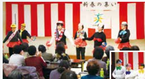
▲歌や踊りを楽しむ部員ら(追分生活センター)

また防犯講話もあり、秋田臨港警察署生活安全課の警察官が、特殊詐欺対策について説明し、振り込め詐欺など実例を交えて注意を呼び掛けました。