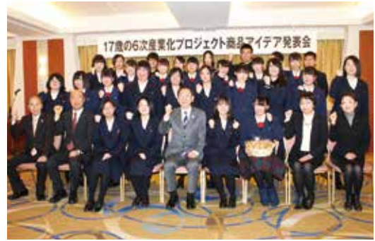
▲プロジェクトに参加した生徒と関係者(秋田キャッスルホテル)

金足農業高校と秋田商業高校、秋田工業高校の生徒ら28名が連携し、秋田市の地元農産物などを使用したオリジナルの商品を開発する「17歳の6次産業化プロジェクト」の平成27年度商品アイデア発表会が2月3日(水)、秋田キャッスルホテルで開かれました。今回発表された商品は、枝豆とお米を使ったプリンやりんごとカボチャのペーストと肉味噌を練りこんだパイなど全部で5種類です。 今年の11月から県内外のコンビニエンスストアなどで販売される予定です。