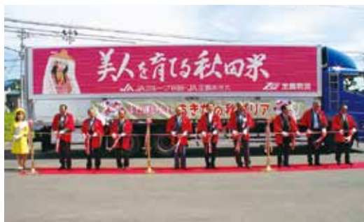
▲トラック出発に際し、テープカットする関係者(雄和園芸集出荷施設)

船木組合長は「秋田市産ダリアは品質が優れ評価が高い。全国に行き渡るよう頑張る、販売額1億円を必ず達成する」と話しました。