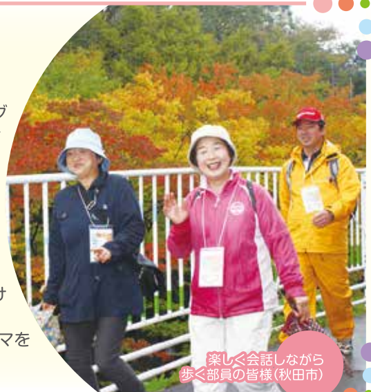
楽しく会話しながら 歩く部員の皆様(秋田市)

JA新あきた女性部では、今後も「健康」「食事」「健診」の3つのテーマを柱として、様々な取り組みを企画・活動していきます。