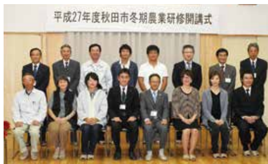
▲これから半年間苦楽をともにする受講生と講師ら(秋田市園芸振興センター)

この研修は、園芸品目に特化した年間を通じて農家所得が確保できる周年型農業の普及促進を図り、冬期間の野菜等の栽培を志す市内農業者を対象に栽培実習を行うことを目的としています。市内在住の21〜66歳の男女で稲作農業を営む農家や就農予定者ら8人が2期生として、来年3月までの6ヶ月間受講します。JA新あきたの営農指導員2名も講師を務めます。