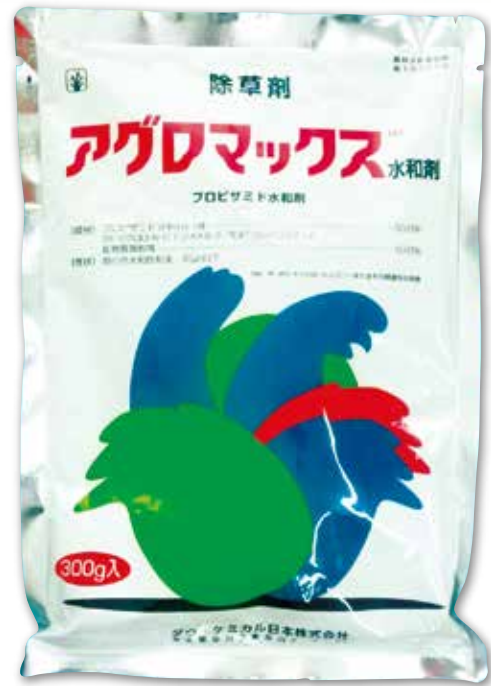
▲アグロマックス水和剤