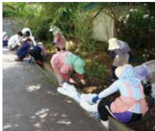
▲会話しながら楽しく作業。さすが農家の皆さん手際よくスピーディーに進みました。

した。女性部北地区では、昨年からのボランティア活動の一環として草刈りの訪問を行っています。参加者は、「作業後の周辺はとて綺麗になり、すがすがしく晴ればれとした気持ちになりました」と話していました。