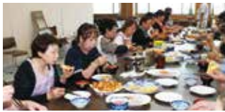
▲こめ油を使った手作り料理で和やかに会食。

ツナとコー ンのピザ、和 風味のチー ズスープ、玉 ねぎとサー モンのサラ ダ（甘酒ド