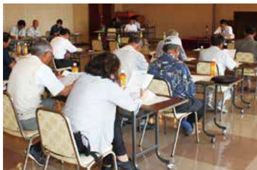
▲話に耳を傾ける参加者の皆様(河辺支店)