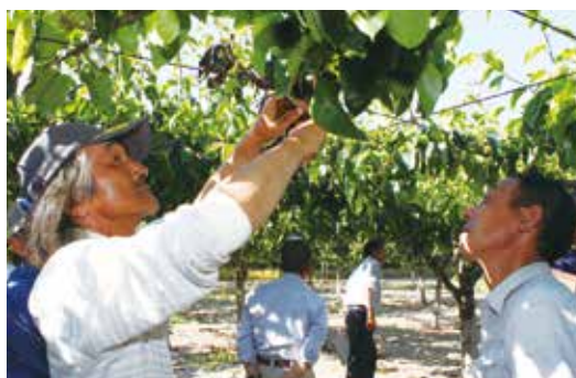
▲園地で梨の生育を見る生産者ら(下新城・中野地区)

春先から降雨が少ないことで、初期肥大への影響が心配されましたが、結実、肥大状況も良くその後は摘果作業も順調に進みました。また、黒星病やハダニなどの病害虫も目立たなく、防除の効果が出ています。今年の収穫は平年より1週間くらい早まる予想です。部会では、今後も園地巡回や技術研修会を積極的に行い、大玉で高品質な梨の生産に努めます。