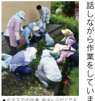
▲炎天下での作業。皆さん汗だくです。

女性部北地区は7月3日（金）、デイサービスセンター「悠楽館」で、消火訓練と草刈りのボランティア活動を行いました。女性部員8名は、猿田興業様のご協力のもと、一人ずつ水の出る消火器で消火活動の実演をしました。その後、陽射しが照りつけ気温が上昇する中、悠楽館周辺の草取り作業を行い、楽しく会話しながら作業をしていま