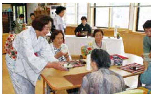
▲お茶を振舞う表千家茶道サークルの皆様 (デイサービスセンター悠楽館)

利用者からは「こういう機会はなかなかないので嬉しかった。正式なお茶の作法やお菓子の食べ方などを詳しく知りたい」と話していました。