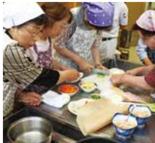
▲各班に分かれ調理。あつという間に下ごしらえ終了。

レッシング）、ミニアメリカンドックの4品を作りました。3班に分れ調理に取り掛かり、息のあったコンビネーションとチームワークの良さで色鮮やかに仕上がりました。部員は楽しく会話をし、親睦を深めながら手際よく調理をし、その後みんなで作った料理を味わい楽しいひとときを過ごしました。