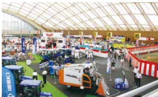
▲農業機械の祭典 新機種多数展示(あきたスカイドーム)

当JA管内から生産者559名が会場を訪れ、最新の田植機やトラクターの特性を聞いたり、試乗をしたりするなど担当者の説明に耳を傾けていました。また肥料や農薬、農業用資材の展示、営農や農業資金に関する相談コーナーなども設置され、会場は賑わいを見せていました。