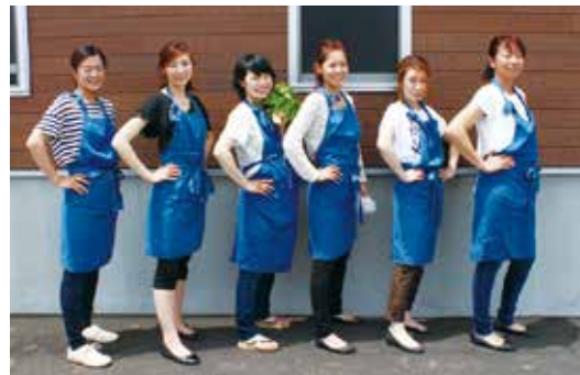
▲Ane Komachiのメンバー6名(秋田市園芸振興センター)

今後も農作業の合間を縫って集まり、新商品の開発とともにメンバーの気持ちをひとつに絆を深めていきます。