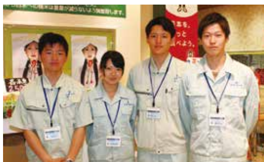
▲秋田工業高校のインターンシップの生徒の皆さん(あぐりんなかいち)

生徒らは「接客を通じ、お客様とのつながりを感じました。農産物が多くの人たちの手を経て食卓に並んでいることを知り、とてもありがたいと感じました」と話してくれました。JA新あきたでは、今後も農業やJAを身近に感じてもらう活動を行っていきます。