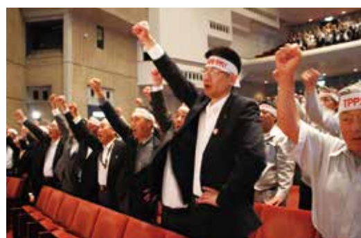
▲ガンバロー三唱をする参加者(秋田市文化会館)

また「最後の最後まで粘り強く運動を展開する」とした集会決議を満場一致で採択し、ガンバロー三唱で閉会しました。