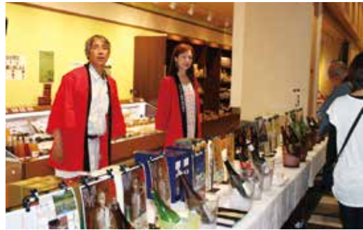
▲日本酒の試飲販売をする職員(あぐりんなかいち)

店舗前の屋台では、営農経済部の職員が地場産の野菜やシイタケなどの串焼きを販売し、店舗内では秋田の日本酒の試飲販売を実施、約14種類を用意して来場者を楽しませていました。また、先月25日にオープンしたばかりの「Jまんま」も、弁当や惣菜などを販売し、秋田のおふくろの味を提供しました。