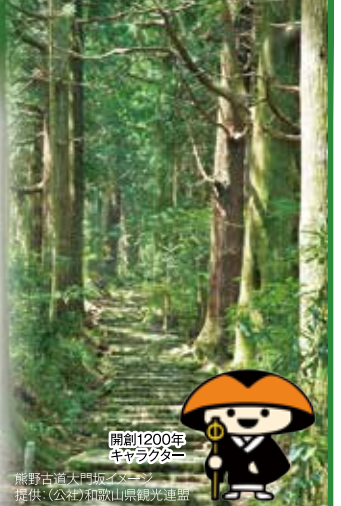
開創1200年キャラクター 熊野古道大門口イメージ

※コース表に記載されている時間は目安であり、交通事情、天候などで変更になる場合があります。