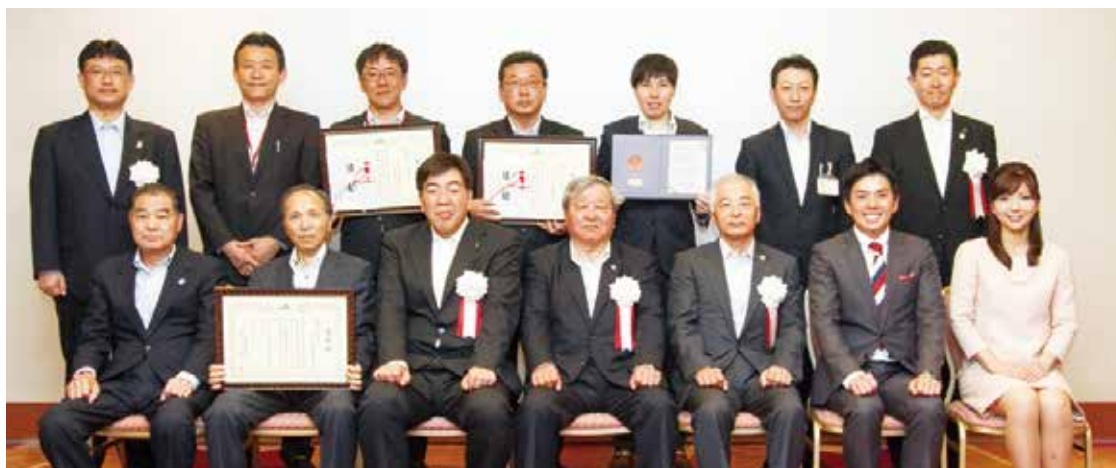
▲船木組合長(前列左から2番目)を始め、表彰された職員と関係者の皆様(秋田市秋田キャスルホテル)

平成27年度もこれまで以上に組合員・利用者の皆様のお役に立てるようサービス向上に努めてまいります。