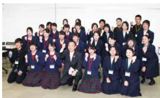
▲穂積市長(前列中央)を中心に、新商品の開発に挑戦する生徒ら(アルヴェ)

毎年、JA新あきたも協力機関として、農産物の提供や圃場見学の支援などサポートを行っています。