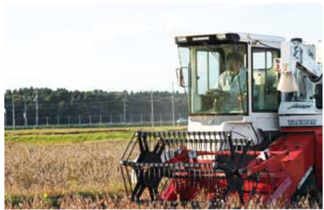
▲乾燥状態を確認して収穫作業を行いましょう。

青立ち株やタデ等、大型雑草が多いと汚損粒やトラブルの原因となりますので、事前に抜き取るようにしてください。