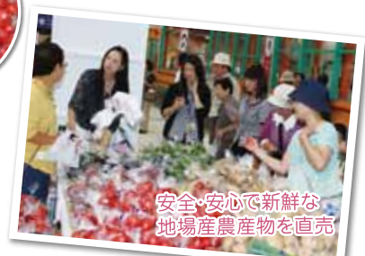
安全・安心で新鮮な 地場産農産物を直売