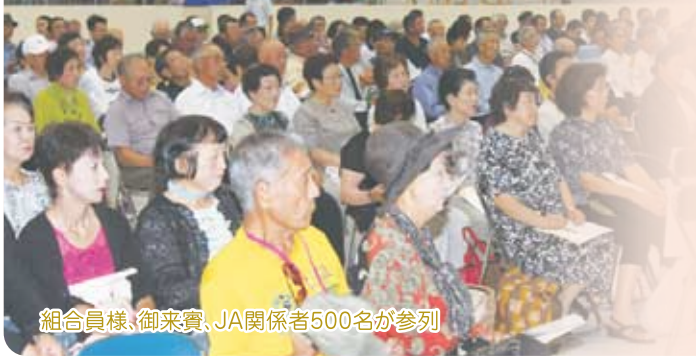
組合員様、御来賓、JA関係者500名が参列