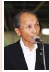
式辞を述べる 船木組組合長