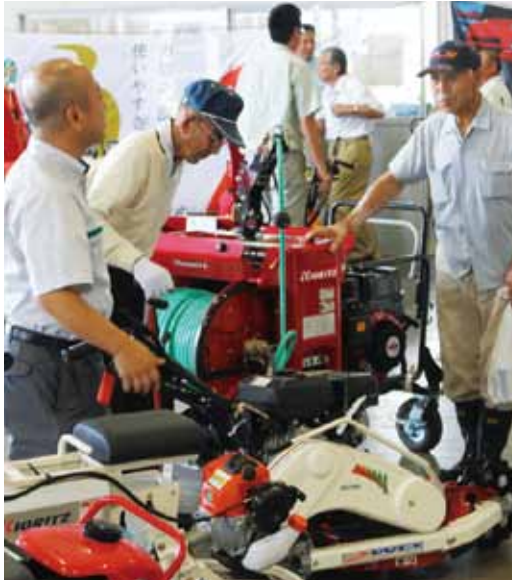
▲機械の性能を確認する来場者(四ツ小屋低温倉庫)

13社のメーカーが最新のコンバインやトラクター、草刈機などを多数展示し、来場者は手にとって機能を確認しながら担当者の説明を聞いていました。2日間で168名の組合員の皆様からお越しいただ いよいよ稲刈り等が始まる中、農機具に関するお問い合わせについては、お気軽に両農機具センターにご連絡ください。