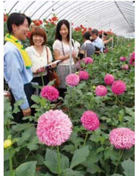
▲生産現場を視察する実需者と関係者(雄和地区)

秋田市とJA新あきたは8月26日(火)、ダリア生産者と市内のブライダルを手掛けるフラワーショップと初めての交流会を開きました。 秋田のダリアを求められるので、使用する際は注文を早くいただきたい」と要望していました。 9月1日(月)には目揃会を実施し、本格的な出荷が始まり、10月いっぱいまで最盛期が続きます。