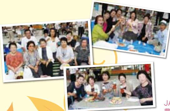
JA新あきたが取り組んでいる 農産物の最重点品目であるダリアや 枝豆の栽培について紹介