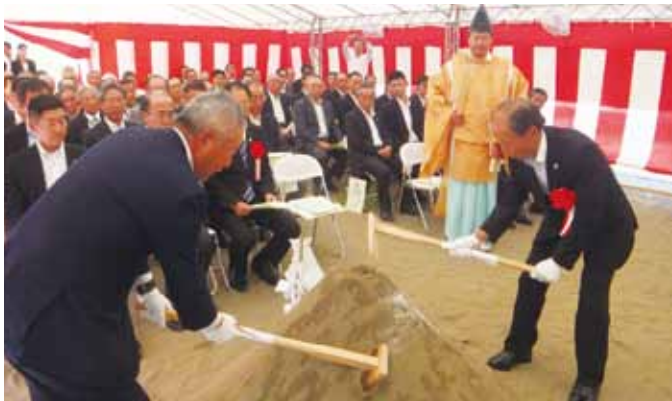
▲鍬入れを行う中泉代表とJA新あきた船木組合長(追分グリーンセンター敷地内)