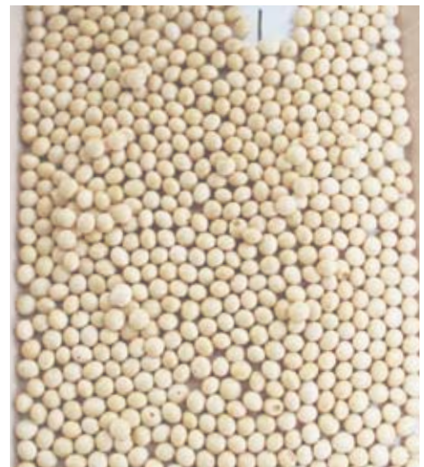
▲目指せ!300A(反収300kg、等級1・2等)