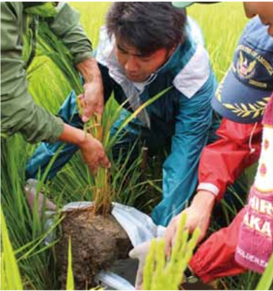
▲株を採取し土壌改良材の効果を確認する営農指導員(雄和地区)

今後各関係機関と連携し、土壌診断により圃場に適した土壌改良剤の施用を薦めてまいります。