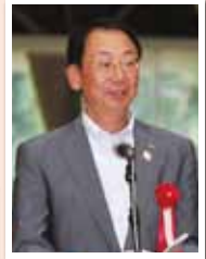
穂積志秋田市長をはじめ各界のご来賓からご祝辞をいただきました