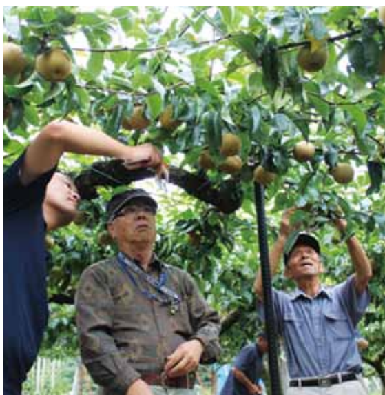
▲生育状態を確認する生産者(下新城地区)

今年は、主力品種「幸水」の果実の大きさは平均比を上回っており、糖度も平均で12.1度と良好。追分梨の特徴