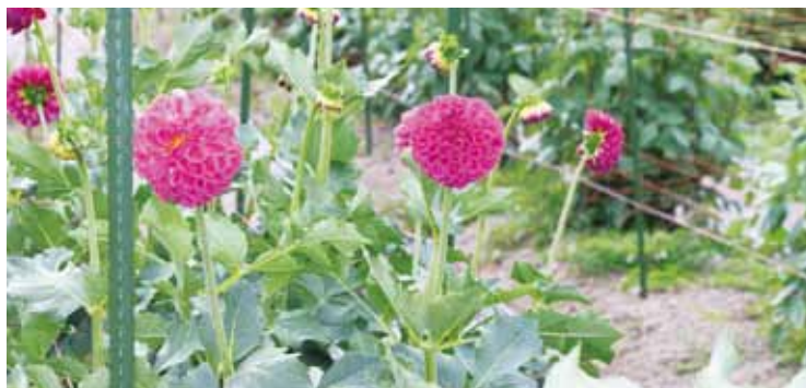
▲平年通りに作業が進められているダリアの圃場