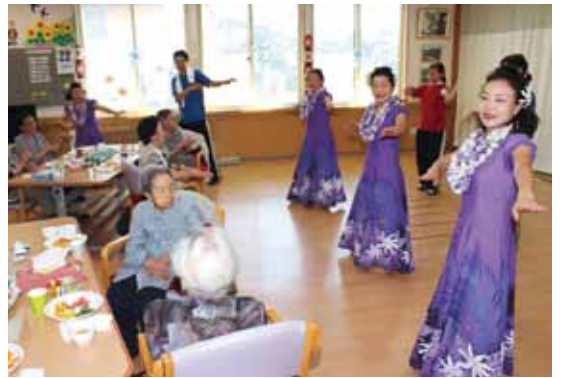
▲フラダンスを一緒に楽しむご利用者様(デイサービスセンター悠楽館)

状態の維持とご利用者様相互の交流で過ごしやすい空間作りをしていきたい。様々なイベント等でスタイルを変えながら、登録利用者の増加へつなげたい」と話してくれました。