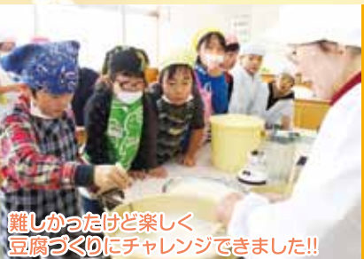
難しかったけど楽しく豆腐づくりにチャレンジできました!!