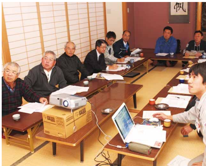
▲スクリーンで今年を振り返る部員(下新城地区)

同部会では今年度の反省を踏まえ、6月中の早期摘果作業や仕上げ摘果、さらに、目揃会の早期開催を行うことなどを再度確認し、次年度への良品質生産に取り組んでいきます。