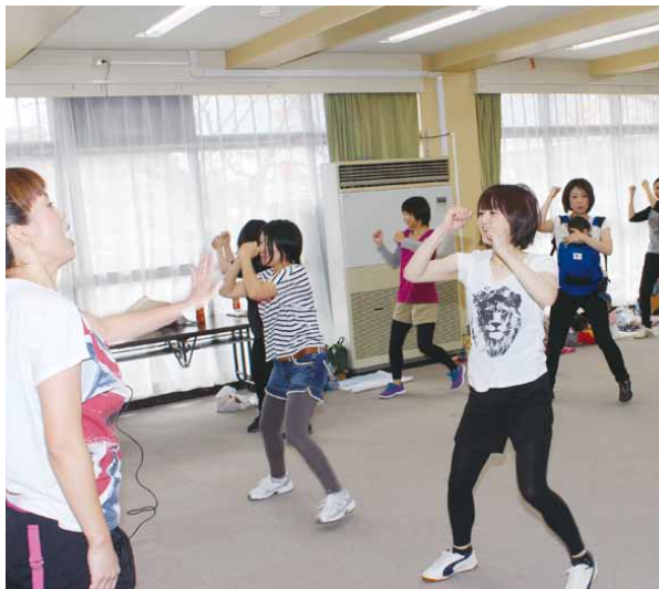
▲講師の指導で身体を動かす参加者(ジョイナス小ホール)