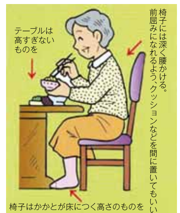
椅子はかかとが床につく高さのものを