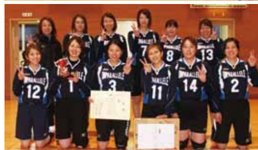
◀アンパラレル(女子)