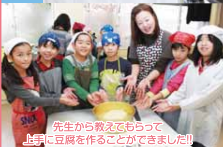
先生から教えてもらって上手に豆腐を作ることができました!!