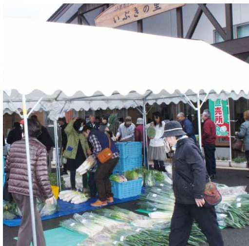
▲白菜や大根などを買い求める客で賑わう直売センター(上北手地区)