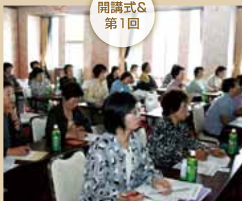
平成23年6月22日(水) JA新あきた会館