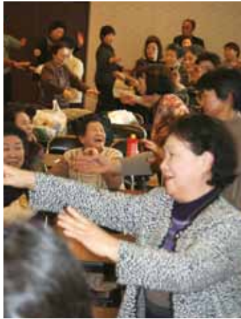
▶最後に参加者全員で踊り、盛り上がりました (追分生活センター)

J A新あきた女性部追分地区は1月20日(金)、J A新あきた追分生活センターで部員同士の親睦と交流を図ることを目的として「新春の集い」を開催しました。