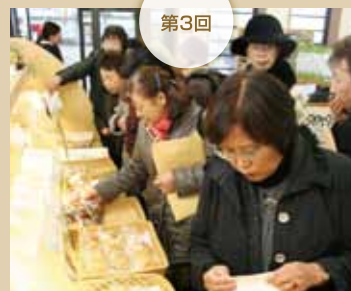
平成23年11月24日(木) JA秋田やまもと管内