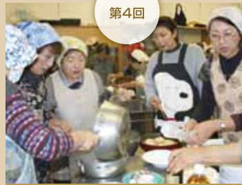
平成23年12月15日(木) JA新あきた河辺支店