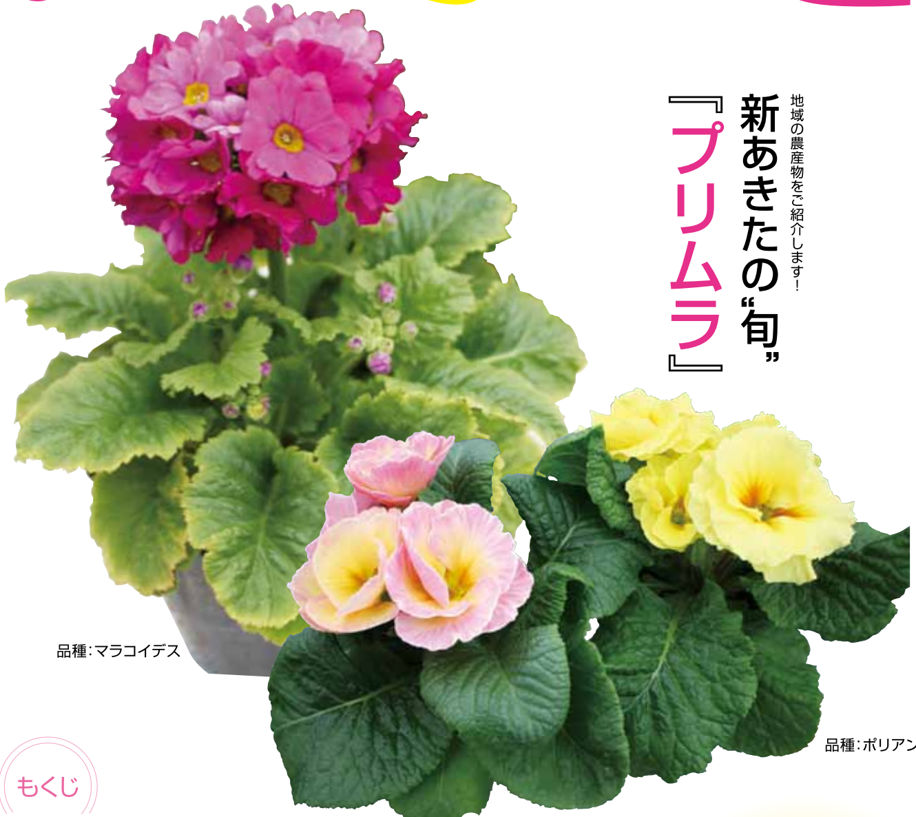
品種: マラコイデス