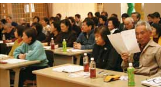
▲スクリーンで画像を見ながらの講習会(ユフォーレ)

質疑・応答では、日頃から疑問に思っていた肥料農薬の使用量や病害虫の防除方法など多くの質問が参加者から出されました。