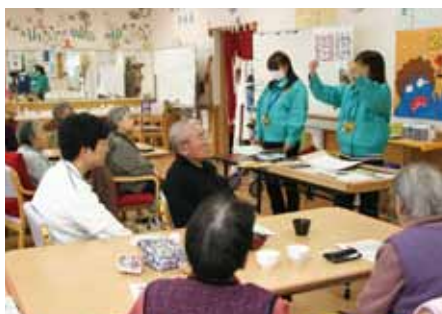
▲紙芝居で交通安全を学ぶご利用者様(悠楽館)