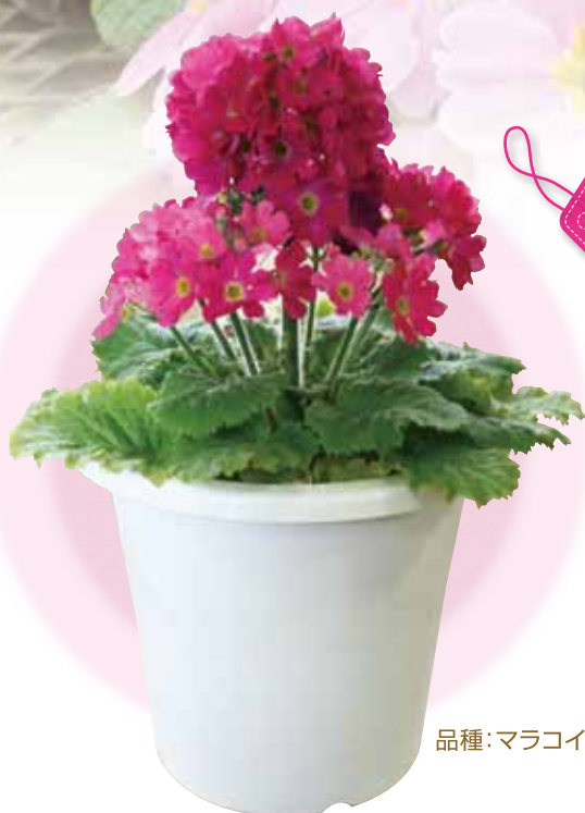
品種: マラコイデス