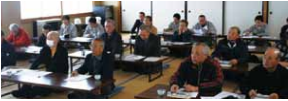
▲栽培方法について指導を受ける生産者(雄和サイクリングターミナル)

平成23年度は「8月中旬収穫までの作型で本格的なマルチ栽培の導入により安定収量の確保につながりました。8月中旬以降収穫の作型では天候不順の影響を受けたものの生育期間は順調に推移しました。」とJA担当者から報告されました。今年度、東京都の大田市場で第2回秋田県産えだまめ品質査定会が開催され、2年連続で品質1位に選ばれました。