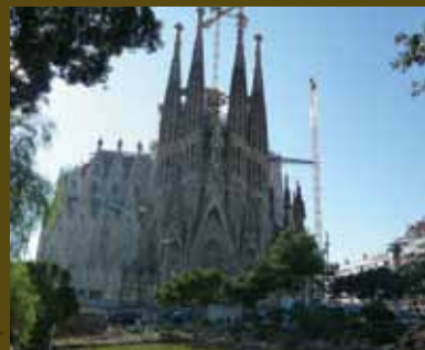
▲サグラダ・ファミリア