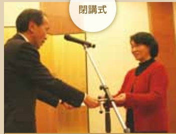
平成24年2月3日(金) 秋田キャッスルホテル