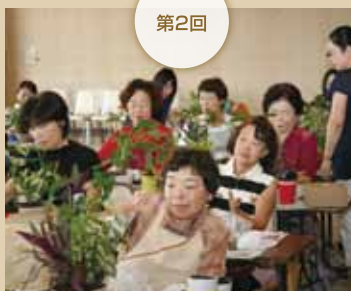
平成23年8月26日(金) JA新あきた河辺支店