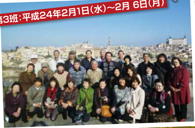
▶トレットの街並み

旅行センターでは、今後もお客様から喜んでいただける旅行を企画してまいります。これから旅行の計画を立てる方や行ってみたいところがあるけれども、どうしたらいいかわからないなど旅行に関することは【JA新あきた旅行センター】にお気軽にご相談ください。