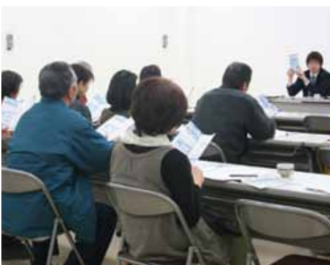
▲旅行中の説明が参加者に伝えられた(J A 新あきた東支店)