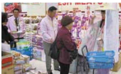
▲買い物客にあきたこまちをPR (東京都大田区イトーヨーカ堂大森店)