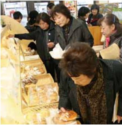
▶ J A やまもとの J A ンビニを見学する部員(山本郡三種町)

参加した部員は、「地産地消の重要性についてあらためて学ぶことができました。」と今回の講座について振り返っていました。