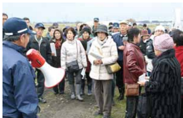
▲冬期野菜の栽培方法を聞く生産者(追分地区)