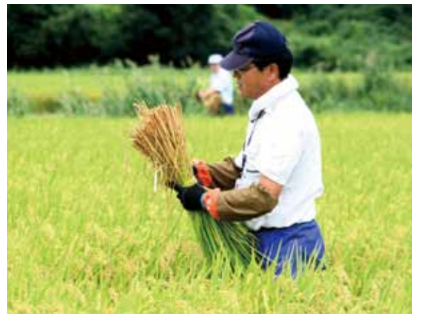
▲調査のため稲の刈り取りを行う県職員(金足地区園場)