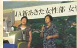
▲追分地区 お父さん

今後も、女性部が生き生きとした活動を展開し、JAを盛り立てていきます。 女性部の活動に是非参加してください。