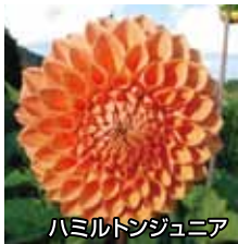
ハミルトンジュニア