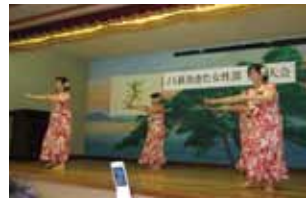
▲北地区 フラダンス