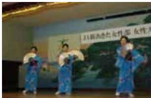
▲南部地区 真室川音頭