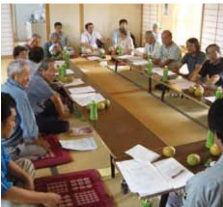
▲出荷の荷姿規格を確認する部会員(中野地区)

今年度のJA新あきた管内での梨の生育・成熟状況は、開花の遅れや8月下旬の曇天が影響し、小玉傾向にあり、出荷は平年より1週間ほど遅くなっていますが、品質が良く糖度(11度〜12度以上の品)も上がっています。9月3日(土)には、秋田市中央卸売市場で、10日(土)にはナイス外旭川店でそれぞれ追分梨の試食PR活動が行われ、市場関係者や消費者にアピールしました。