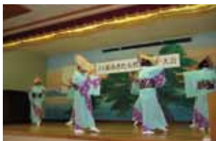
▲雄和地区 大正寺おけさ