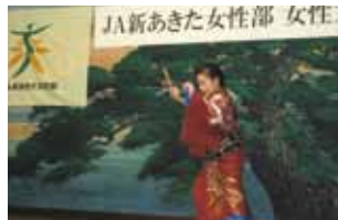
▲河辺地区 人生勝負