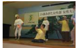
▲雄和地区 健康体操