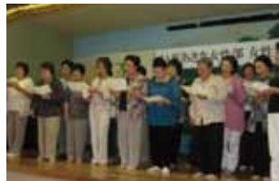
▲西部地区 ふるさと赤とんぼ