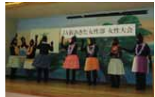
▲南部地区 ハメハメ八大王