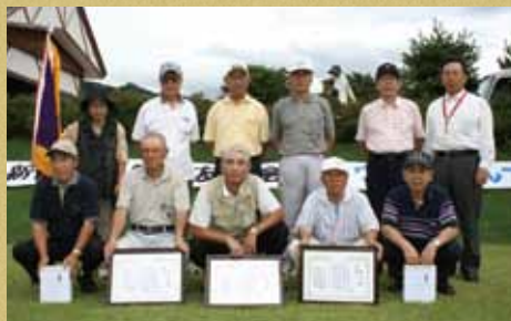
▲団体の部 優勝の秋田県農協ビル支店Aチーム