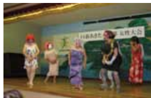
▲河辺地区 だんな様