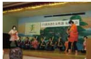
▲北地区 スコップ三味線