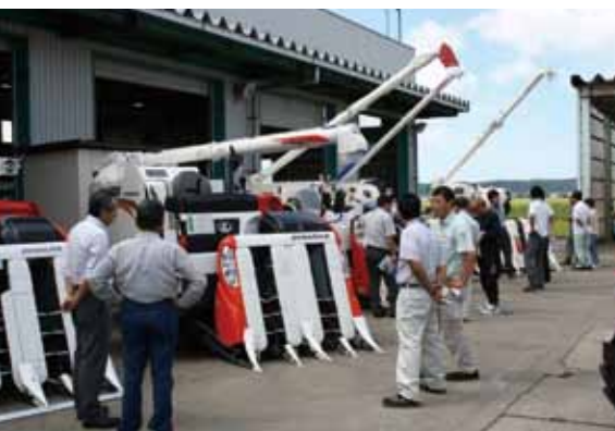
▲最新の農機具がズラリと展示されました。(南部農機具センター)

2日間で143名の来場者があり、また、お越しいただいた方には粗品を進呈し、JA職員や各メーカーの担当者が丁寧に説明をしていました。