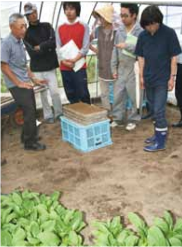
▶当日は現地研修会も行われました。(四ツ小屋チンゲンサイのハウス)

そこで、冬期野菜の増産で所得向上を目指そうと、JA新あきたと秋田市は、9月13日(火)にJA新あきた北支店と雄和支店において北地区・南地区にそれぞれ分かれ「冬期農業チャレンジ講習会」を開催しました。