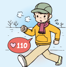
ちよつとぎつめのウォーキング

慣れないうちは後半にスピードダウンしますが、無理にスピードを上げる必要はありません。疲れ始めてからスピードを維持しようとすると、強度が上がってきます。ペースダウンしても強度が同じであれば持久力は高まってきます。見つけた自分のスピードで歩き続けることと、運動後に脈拍数を測る習慣が大事です。歩く途中フォームが乱れると、悪い癖がつきがちです。すぐに修正することも忘れないでください。