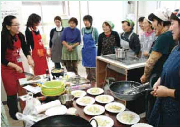
●講師の話に耳を傾ける女性部員(雄和支店)

雄和地区女性部では、今年度のテーマを主婦に身近な「快適な生活」とし、雄和地区の女性部員を対象に今後も様々な内容の講習を行うべく予定しています。