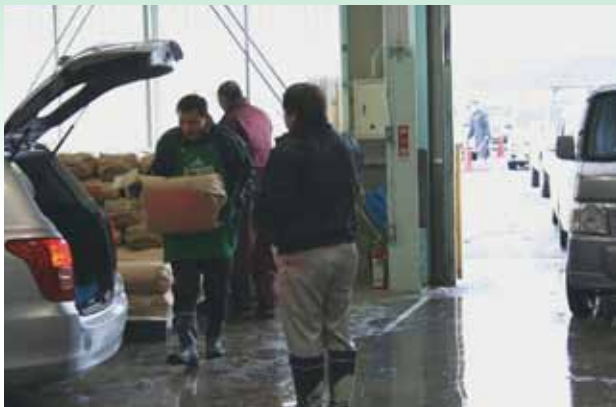
● 玄米を車へ運び込む職員 (四ツ小屋低温倉庫)

今後も販売への自助努力をさらに強化し、売れる米づくり・安全で安心な信頼される「JA新あきた米」販売に全力で取り組んでいきます。