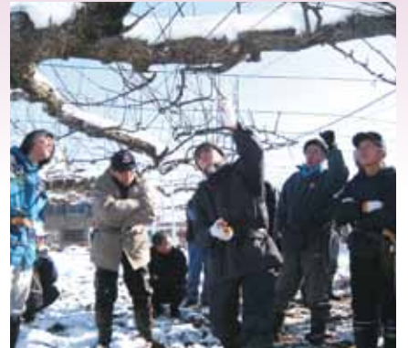
●県果樹試験場の担当職員から剪定の指導を受ける部会員(下新城ほ場)

これからの課題として「あきづき」へ品種更新を進め、2〜3年後を目標にまとまった量を市場出荷していきたい考えを示しました。また、来年度へ向けた剪定作業の講習も同日に行われ生産者は担当職員による剪定方法に聞き入りました。