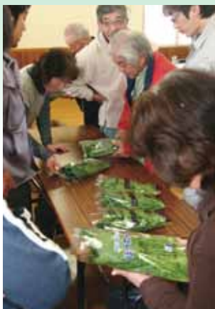
●出荷基準を確認する生産者(北支店)