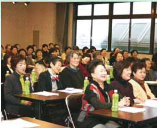
● 会場が笑いで包まれる (追分生活センター)

また、各支部の持ち寄りによる新春園芸プログラムが行われ、新年から元氣一杯の女性部員による歌や踊りが披露され、集いは部員の親睦を深めると共に盛り上がりを楽しみました。