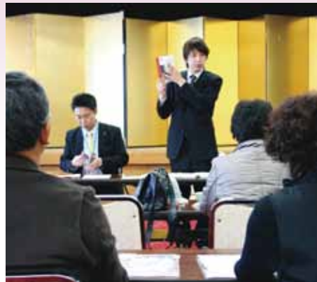
● 旅行の注意点を説明する担当者 (JA新あきた会館)