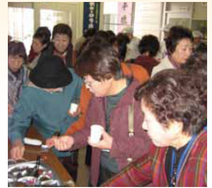
●漬物の味を研究する部員 (横手市平鹿の浅舞婦人漬物研究会工場)

また、12月8日(水)には河辺支店で第5回目が開講され「年末年始にぴったりの簡単おもてなし料理」で炊きこみずしなど6品を調理したほか、キャンドル作りにも挑戦しました。参加した塾生からは楽しい笑い声が聞かれ、盛り上がりをもみせた講義となりました。