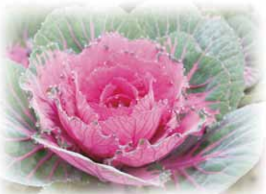
(品種:ウインターチェリー)

この冬の時季でしたらお花屋さんでも切花、鉢植えと色々揃っています。切花でも、とても日持ちが良く、華やかな色合いのものもたくさんありますので、花束やアレンジなど洋風、和風を問わず合わせてお使いいただけます。春先になって抽台(とうが立つ)した物も、変わった寄せ植えとして使われたりします。季節の贈り物や新年のごあいさつのお花としてもとても最適です。