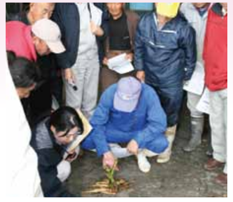
●市場関係者からアドバイスを受ける生産者 (雄和サイクリングターミナル)

J A新あきた花き部会ダリア班は11月15日(月)栽培研修会、26日(火)には、秋田市雄和サイクリングターミナルで実績検討会を行いました。 栽培方法や出荷実績を基に今年度を振り返り、参加者同士が技術向上への意見交換により、ダリアの安定出荷と品質確保をしていくことを話し合いました。