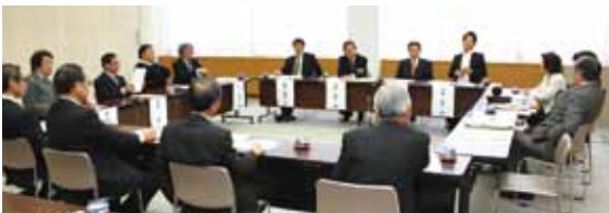
●生産調整について意見を交わし合う(秋田県庁議会議棟)