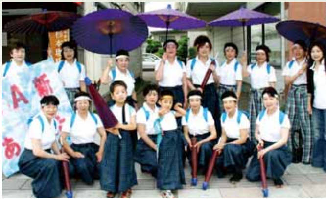
●踊りで会場を盛り上げた女性部河辺地区部員

祭には、県内外の幼児から高齢者まで幅広い年齢層の踊り手68チームが参加しました。鮮やかな衣装を身に着け、躍動感あふれる演舞を披露し、会場を訪れた観客と共に熱気に包まれていました。