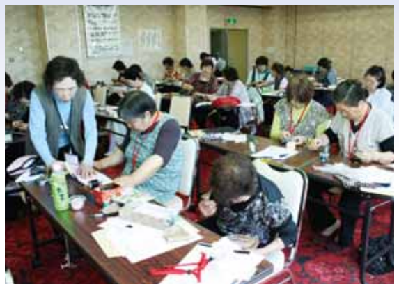
●マイボトル袋作りに励む会員