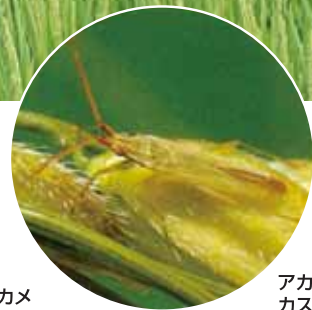
アカヒゲホソミドリカスミカメ