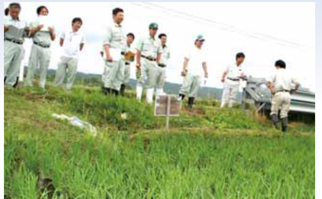
●圃場で除草効果を確認する参加者

当組合の職員による肥料や農薬などの販売コーナーの前も多くの来場者で埋め尽くされました。