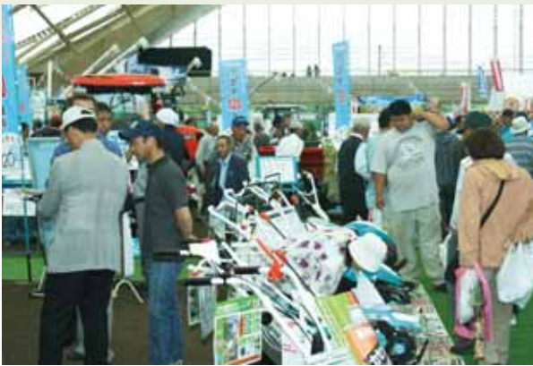
●多くの来場者で賑わいを見せた展示場