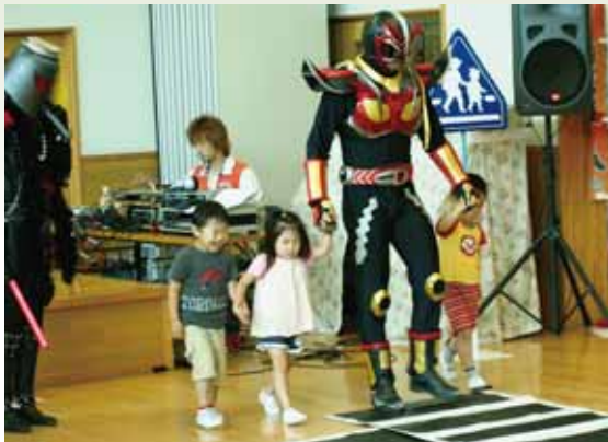
●ネイガーが園児らに交通安全を指導