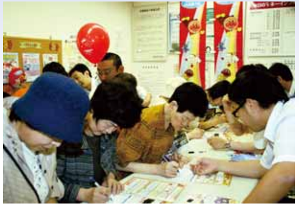
●たくさんの人でにぎわうJA共済のコーナー