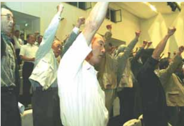
●意思を集結しガンバロウ三唱をする参加者

結果は良好で、来年度には、使用する農薬を半分以下に減らす稲作体系「あきたeコロリス」を中心に新規除草剤の普及推進を行う予定です。