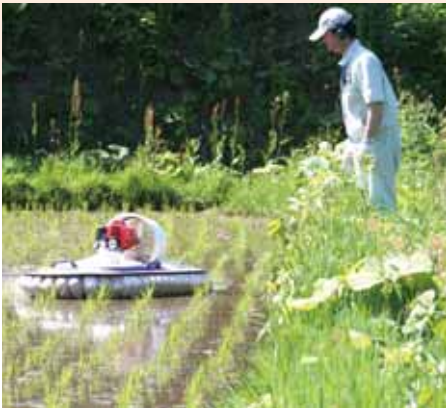
●ホバークラフトのデモ散布の様子

当日も水田に藻が発生した状況でしたが、しっかりとかき分け除草剤が水中に吐出され拡散していく様子が確認できました。このデモ散布は2、3年前から始まっており、現在では法人や様々な圃場で使用され、今後大規模圃場での活躍が期待されています。