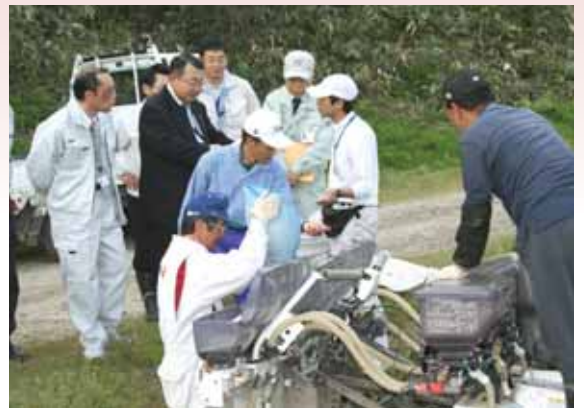
●播種作業を見守る関係者