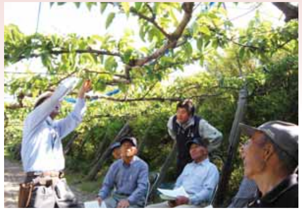
●講師から指導を受ける生産者

果樹部会なしぶどう部は6月3日(木)、園地全体巡回を下新城中野地区で行いました。部会員・秋田県地域振興局普及指導課・市場JA担当者10人が参加しました。現在の結実状況は、4月の低温・開花後の低温降雨・霜害などの原因のため、受粉後の受精不良であり良くないと報告しました。今後の対応としては、①『養分の転換期』は微妙な時期のため管理維持に大事な時期②『大玉・良果生産』判別可能な範囲で、摘果は早いほうが良い③『黒星病』防除として、今年の天候下では油断できないなど管理の要点を確認しました。