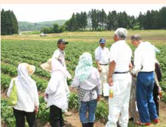
●講習を熱心に聞く参加者