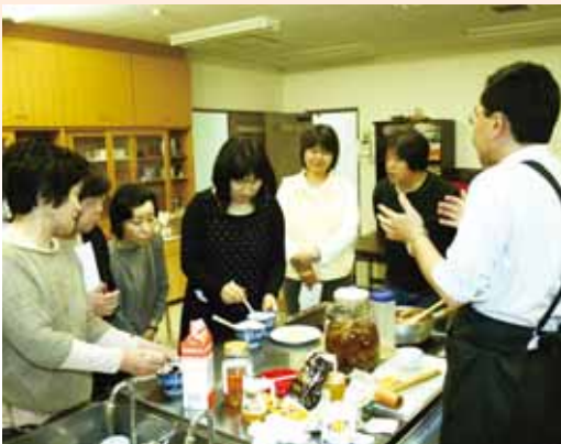
●実演講習で生キャラメル作りをする部員

今後もエコープマーク商品を中心とした共同購入運動の活性化に努めていく意思統べられた研修会となりました。