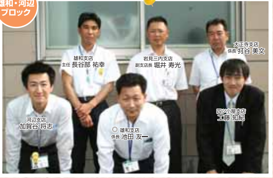
雄和・河辺 ブロック