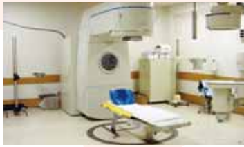
▶放射線治療装置は別名ライナックとも呼んでいいます。を体の外からがんを治療する装置です。

放射線科にある装置はかなり高額な装置が多く、そのほとんどは1千万円以上するものです。中でも1億円を超える装置は7台あります。CT2台、MRI2台、アンギオ装置、心カテ装置、放射線治療装置の計7台で9億円超です。その1億超をたった二人の技師が動かす、検査を行っています。