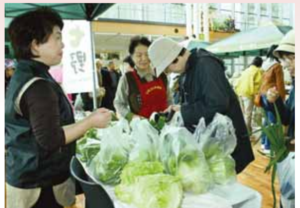
●多くの来場者が野菜の購入で賑わう追分女性部のブース