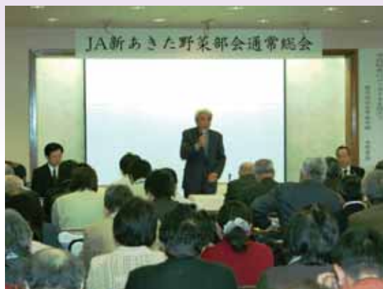
●総会に望む部会員・関係者