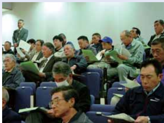
●熱心に耳をかたむける参加者

総会後には研修会が行われ、3人の講師よりジュース用トマトの現状や学校給食に地場農産物の取組み活動についての題目で話され、参加者は興味津々に聞き入っていました。