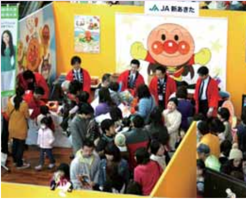
●賑わいを見せたJA新あきたのブース

当組合からも出展し、交通事故防止・交通安全啓蒙を環としたJAA共済のPRを担当職員が行い、アンケートに答えていただいた来場者へ人気のキャラクターグッズがプレゼントされ、子どもたちから大いに喜ばれていました。実に多くの方からのアンケートが集まり、今後の推進に弾みをつけることができました。