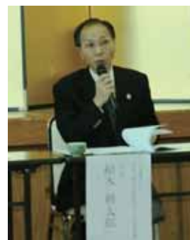
■司会進行をされる 船木組合長

生産者・消費者側としても、両者が100%信頼のもと、今後も安全で安心な農産物づくりに取り組んでいくことを再確認し協議会は閉会しました。