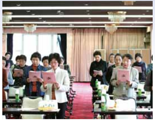
●高らかに歌斉唱が響く