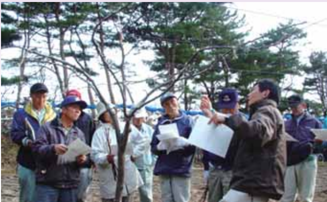
●講師の話に聞き入る参加者

好天に恵まれ参加者も会員の半数以上が参加し有意義な研修会でした。今年も美味しい梨を秋田市内の消費者に届けられるよう会員の気持ちを集めた研修会となりました。