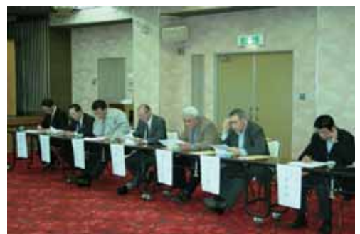
■話を熱心に聴く各部会長