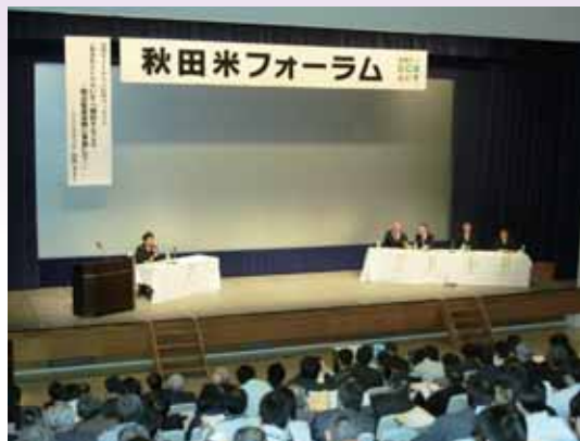
●秋田米のステップアップを目指す参加者

消費者側からみた「あきたe.c.o.らいすに期待すること」と応援メッセージがあり、実際に京急グループの社員が米づくりを体験した話や京急あきたフェアで活動したこと、今後の秋田の米作りで更においしく安全な秋田の米作りを期待していました。