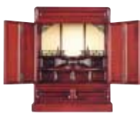
上置仏壇 高49×巾38×奥26 通常価格 64,995円