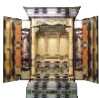
6尺間用 極上金仏壇 高178×巾111×奥78 通常価格 2,268,000円