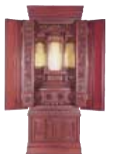
3尺間用 唐木仏壇 紫檀 高171.6×巾70.5×奥58 通常価格 1,312,500円