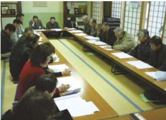
●新あきた職員の説明に耳を傾ける参加者

新あきたは、開設の経緯や現状について説明。出荷者の募集や出荷量の確保などの取組みを紹介しました。また直売所の地域への波及効果として、①高齢・小規模生産者の生きがいや励みになる②市場流通に乗らない規格外品でも収入につながる③地産地消で農産物と金が地域内を循環する—などを挙げました。