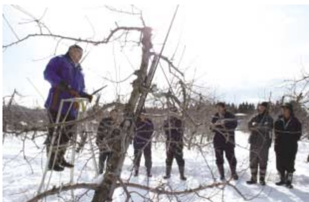
●講師の実演を熱心に見つめる部員(雄和種沢地区)