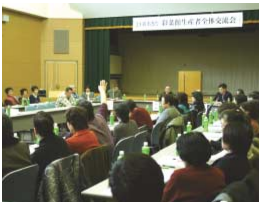
●活発な意見交換が行われた全体交流会