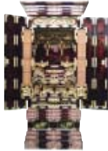
3尺間用 梨地塗仏壇 高150×巾69×奥59 通常価格 567,000円