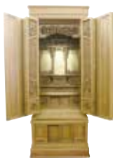
3尺間用 高級唐木仏壇 榆 高173×巾71×奥64 通常価格 871,500円