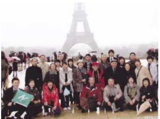
●エッフェル塔前で記念撮影

今回の旅行に参加されたお客様からいただいた貴重なご意見をもとに、来年度も(株)農協観光と新あきた旅行センターが丸となって、地域の方々からお喜びいただける旅づくりに努めていきたいと考えています。