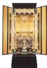
3尺間用 京型金仏壇 高169.5×巾70×奥56 通常価格 824,250円