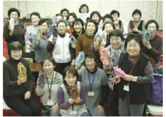
●布ぞうりの出来上がりに満足の様子

お楽しみ講座として布ぞうり作り挑戦。家の光の記事を参考に各自好みの布で鼻緒つま先、土台、かかとの順番に編んでいき、色とりどりの布ぞうりが出来上がりました。参加者は「BDFが身近になった。温暖化を考えていきたい」「布ぞうりを友達にも教えたい」と話していました。