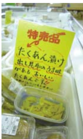
POPを立ててPRしている。試食でのコミュニケーション。