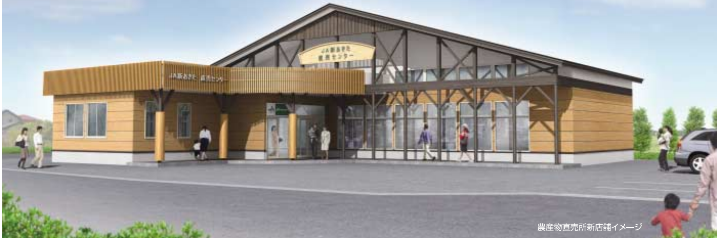
農産物直売所新店舗イメージ

JA新あきたでは「地産地消」運動の拠点施設として、上北手猿田地区（日赤病院北東側）に農産物直売所を7月下旬にオープンする予定です。直売所を拠点とした地産地消の促進と定着を図り、消費者のニーズに即した特色のある農産物の販売や食を通じた消費者との交流、グリーン・ツーリズムなどに努めます。