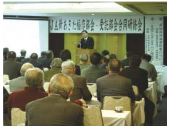
●講師の説明に耳を傾ける部会員

J A全農あきた米穀部の担当者は、「輝きを増す県都矢留の米づくり」と題し、平成21年産水稲の反省と今年度の稲作栽培技術を紹介しました。次年度に向けて、有効茎歩合の高い稲づくりをするよう呼び掛けていました。