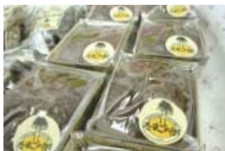
バレンタインデー向けにチョコレートバンドケーキを販売。