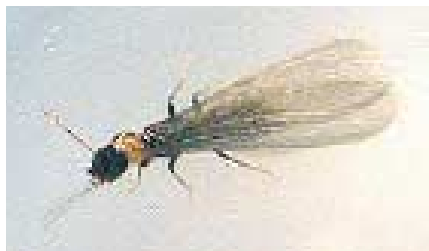
●シロアリの羽アリ