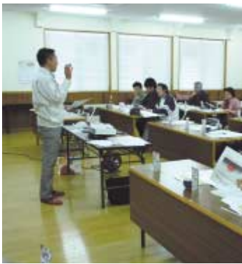
●カゴメが作成したDVDを見ながら指導会が行われた。

また、防除日誌と施肥記録、適用農薬を紹介し、使用農薬は必ず正確に防除日誌に記帳し提出することも呼び掛けました。カゴメでは、独自の評価項目を定め農薬を選定しています。