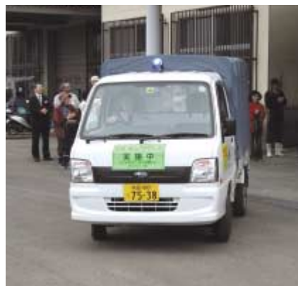
●集まった農家に見守られて出発するキャラバン隊