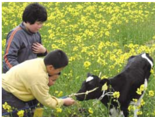
●菜の花とイベントを楽しむ来場者

会場では、参加者に農協牛乳やわたあめなどを振る舞ったり、菜種油やドレッシングを販売しました。菜種油の搾り実演や廃食油をリサイクルしたバイオディーゼル燃料による自動車の試走では、菜の花の匂いがする排気ガスに観客は驚いていました。