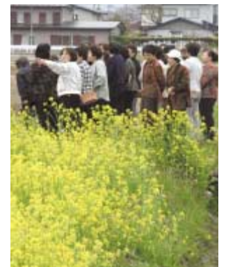
●6月には刈り取り体験を行う