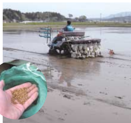
●デモ機による播種作業