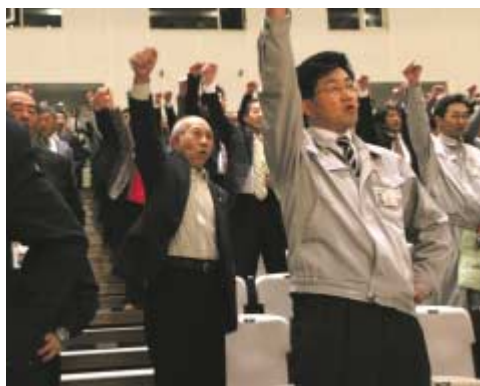
●計画生産と出荷契約積み上げ運動に向け参加者が気勢を上げた

JAの代表者により、JAグループ一体で計画生産に取り組み、生産者が安心して米を出荷できる体制を再構築することなどが決意表明され、JAグループの意志を結集しました。