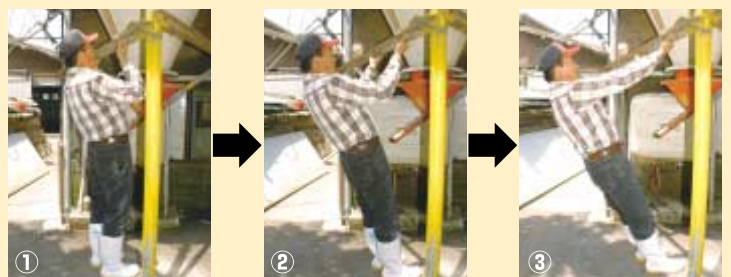
①タンクに付属するL字鋼を両手でつかみます。 ②体を持ち上げるように両腕を曲げていきます。背筋を伸ばしましょう。 ③両腕をしっかり曲げたら、ゆっくりと伸ばします。