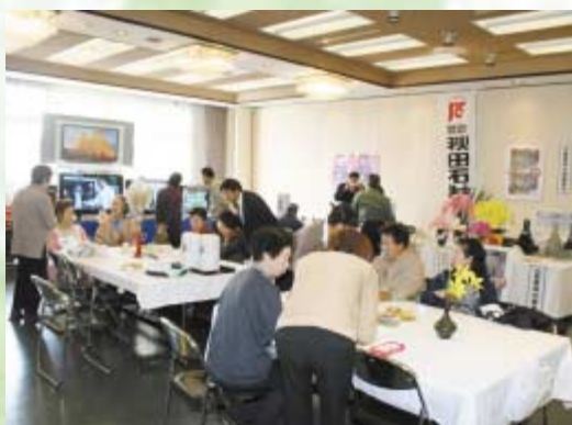
多くの来訪者でにぎわう会場 (レゼール追分)

秋冬期の電化製品や健康商品の展示、さらに営農全般に関する相談会など、バラエティーに富んだミニ展示会を11月4日(火)、5日(水)に、北支店を皮切りに開催しました。 会場には、地上デジタル放送のエリア拡大に併せた液晶フルハイビジョンテレビなどの新商品が多数展示され、人気を集めていました。 また、本格的な冬に備え、ファンヒーターや床暖ストーブな