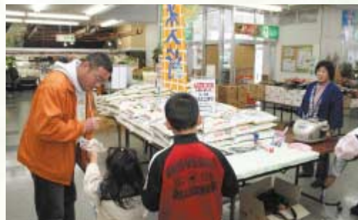
構成員が店内でPRを行った

新あきたのはっぴ姿でPRを行い、生協に訪れたお客さんに炊き立てのコブ米を試食してもらい、その美味しさ知ってもらいました。