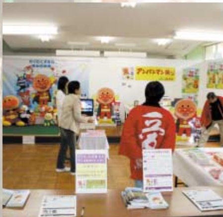
JA共済「アンパンマン祭り」