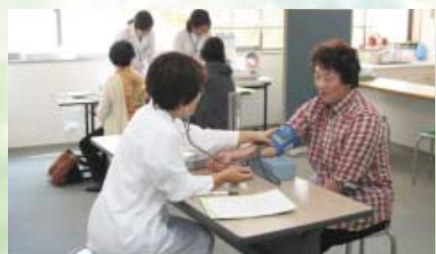
血圧測定する組合員

当JAでは管内の組合員に、単に疾病発見のみだけでなく、健康増進を目的に、総合健診を広報で呼びかけ、年1回定期的に受けることを勧めています。