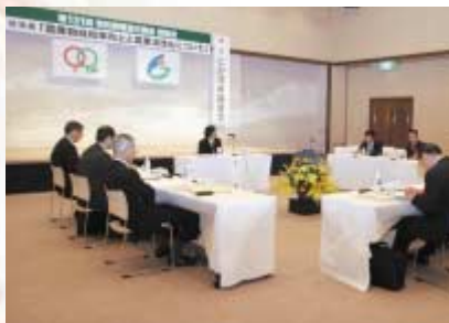
水田を基盤とした県農業の特徴を生かした打開策を探った談話会

しかし、多収品種の導入や規模拡大・団地化といった生産者の努力だけではコスト削減に限界があるため、飼料用米を含めて価格と生産コストの差を補てんする対策を求める意見が出されました。米粉の用途が小麦の代替だけでなく小麦価格が下がれば使われなくなるとして、米の特徴を生かした商品作りも提起されました。