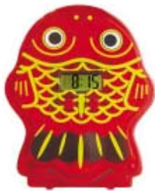
ちよぎんぎょエコクロック

キャンペーン期間中、新規で1年以上の定期貯金(定期積金は給付金額)を20万円以上で契約いただいたお客様に「ちよぎんぎょエコクロック」を1個プレゼントいたします。