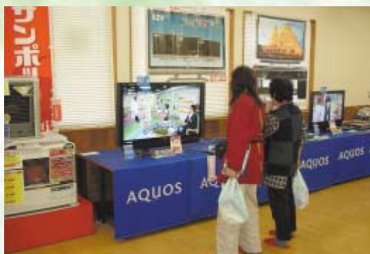
特に地デジ対応の液晶テレビに注目が集まった(北支店)

秋冬期の電化製品や健康商品の展示、さらに営農全般に関する相談会など、バラエティーに富んだミニ展示会を11月4日(火)、5日(水)に、北支店を皮切りに開催しました。 会場には、地上デジタル放送のエリア拡大に併せた液晶フルハイビジョンテレビなどの新商品が多数展示され、人気を集めていました。 また、本格的な冬に備え、ファンヒーターや床暖ストーブな