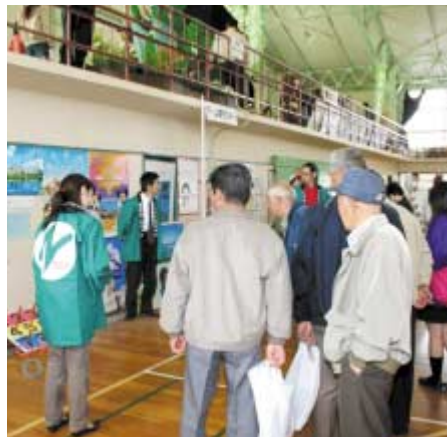
JA旅行センターの輪なげには大勢の人だかり