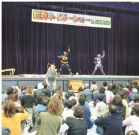
にかほ市生まれの超神ネイガーは子供たちに大人気