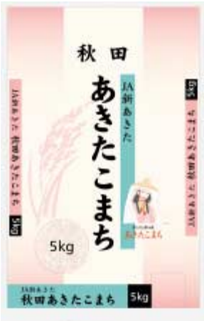
イオンで販売する新あきた産あきたこまちの米袋

また、12月からは大手スーパーのイオンで、米袋のデザインを一新したあきたこまちを関西以西のジャスコで販売を始めま