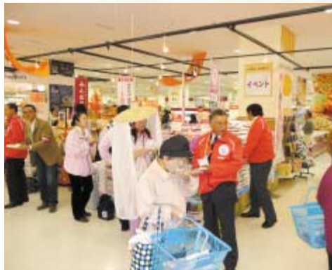
生産者自ら店内でPR

米穀担当者からは「組合員の皆様の親戚、友人に関西の方がおりましたら、ぜひ、新あきた産あきたこまちをPRしていただければ」と話していました。