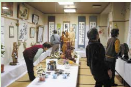
会員自慢の作品を展示

展示会には趣味の輪を超えて色々な人たちが集まり、会員の作品一点一点をじっくり鑑賞していました。