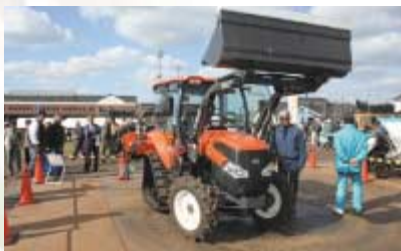
会場では農家の人たちはメーカー担当者の説明に興味津々

協賛第二会場の笹森クリーンセンター前広場で行われた農業機械化ショーには、県内外から大勢の農家らが足を運んでいました。出展メーカーが実演や試乗を交えながら紹介する最新機種に真剣な表情で見入っては、性能などを確認していました。今年の機械化ショーは、担い手向けの大型機械が充実しているのが特徴。省エネや省力化に役立つ機種のPRに力を入れているメーカーもありました。