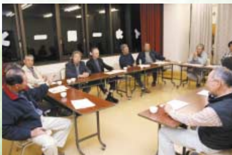
次年度の作付け計画を策定した

酒米研究会は次年度も生産技術向上のための研修会や講習会を開催し、高品質の酒米生産に努めていくことを確認しました。