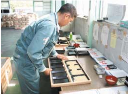
20年産米の初検査を行う職員（豊岩低温倉庫）

管内各地で米の収穫が一段落し、当JAの集出荷施設で9月22日(月)から今年産の米検査が行われました。農産物検査員資格を持った営農担当職員が、生産者の方より集荷された玄米を1袋ずつ殻刺しで米粒を抜き取り、被害粒の混入や整粒歩合、形質などを厳正に検査しました。