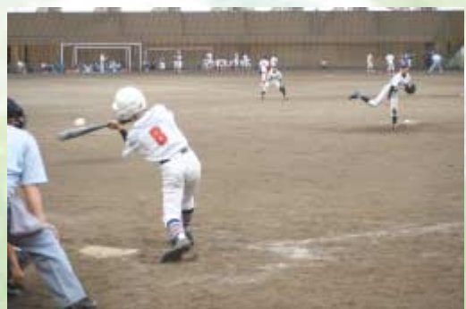
ハツラツとプレーした外旭川野球スポーツ少年団

大会には県下16チーム、309人の学童が参加し、出場した選手達は日頃の練習の成果を披露していました。