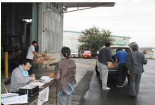
新米の販売開始を消費者にアピールした（四ツ小屋低温倉庫）

また、会場では消費者へ玄米販売についてのアンケートを実施し、希望者には次回開催をダイレクトメール等で送ることとしています。