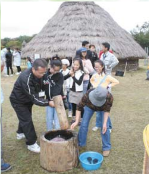
餅つきを楽しむ参加者

国の史跡にも指定されている地蔵田遺跡は、旧石器時代、縄文時代、弥生時代の複合遺跡です。弥生つこ村には、竪穴住居や木柵など弥生時代前期の村が復元されています。