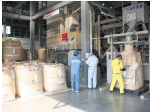
出荷最盛期を迎えた倉庫（川添北部地区ライスセンター）

今年、8月後半の低温、日照不足により登熟が緩慢となったものの、病害虫の発生は少なく、全体的な作柄は平年よりやや良で品質も平年並みとなっております。検査を終えた米は、1等、2等などに格付けし、低温倉庫に保管され県内外に出荷されます。 検査は10月下旬まで行われ、管内全体で約335、000俵を集荷する予定です。