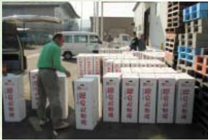
出荷最盛期を迎えたダリア（雄和グリーンセンター）

当JAでは特産化に向けて栽培面積の拡大を図っており、今年度の栽培面積は1.8haとなっています。