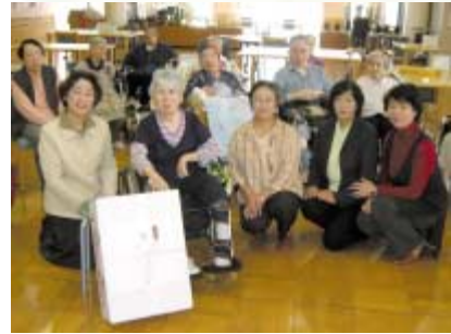
老人ホーム利用者と楽しく記念撮影