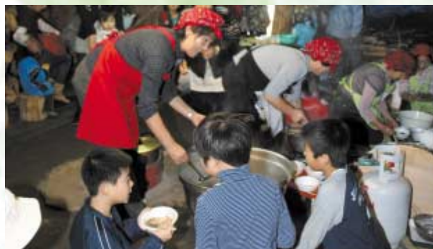
雑煮を振舞う女性部員

御所野公園の地蔵田遺跡で10月11日（土）、弥生つこ村まつりが行われ、四ツ小屋女性部が地産のネギ、ごぼう、古代米を使った雑煮や、採れたての新鮮な野菜を販売しました。会場には家族連れや地域住民ら多くの人で賑わい、弥生時代の体験や和太鼓の演奏、お雑煮・餅つきを体験するなど楽しみました。祭りが最高潮に達したのは女性部員や関係者、地域住民らによる弥生つこ音頭。参加者も「とても楽しい」と一緒に笑って笑顔で踊り、にぎやかな秋を満喫しました。