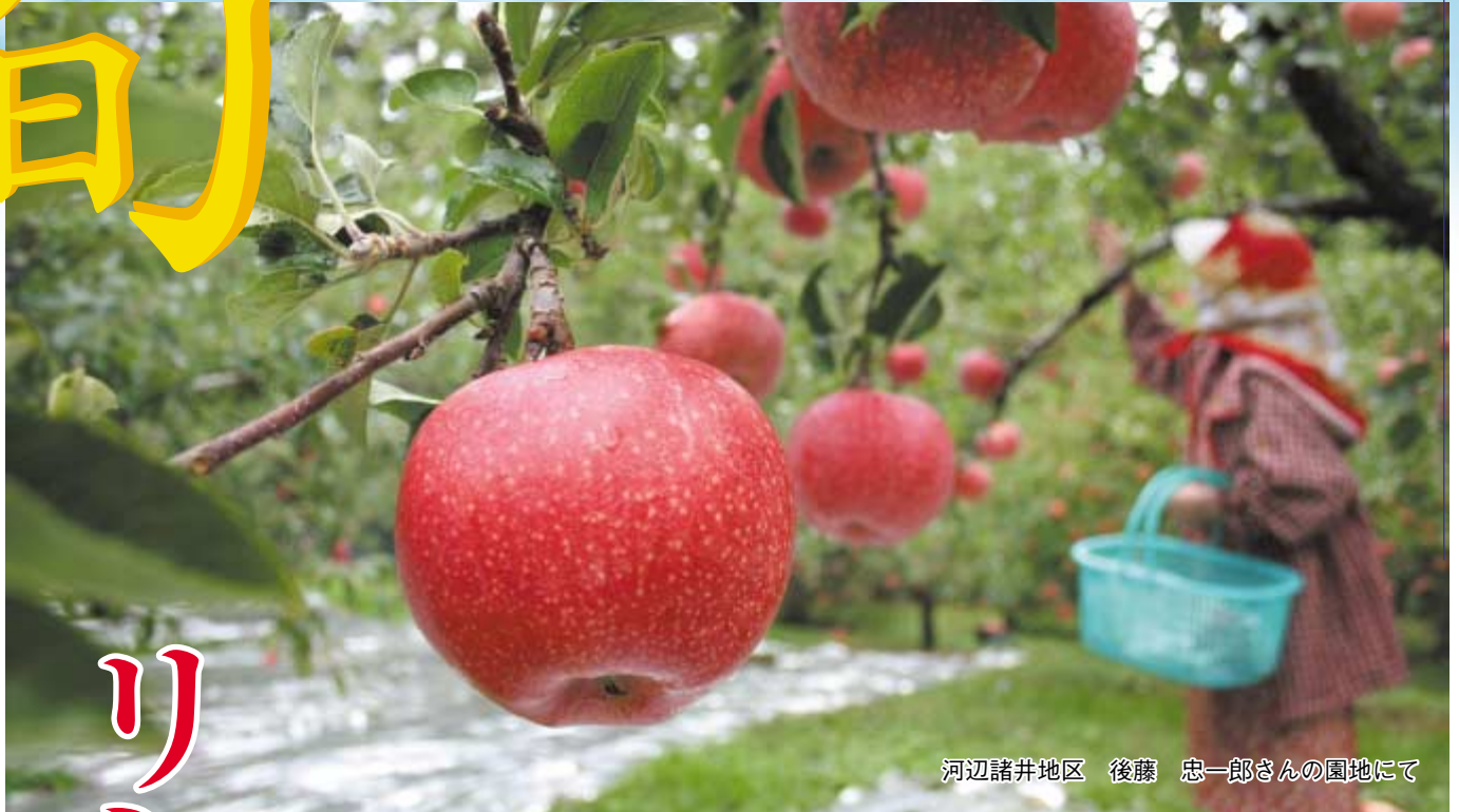
河辺諸井地区 後藤 忠一郎さんの園地にて