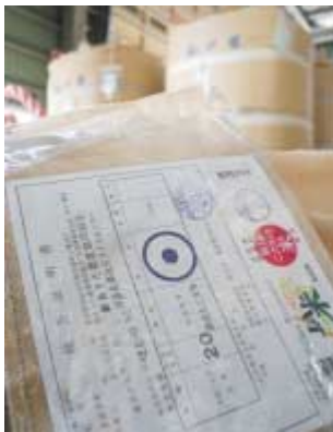
川添北部地区ライスセンター

農産物検査員の養成と技術向上に努め、公平・公正な米検査を実践すること。さらに、米集荷作業の効率化と農業倉庫の整備、ライスセンターの利用向上を重点に進めてきました。