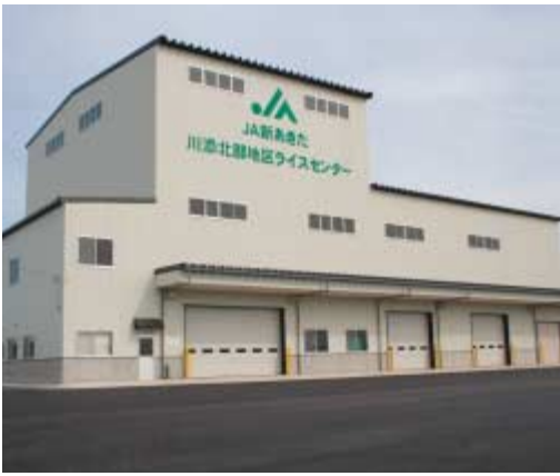
川添北部地区ライスセンター

Q 独自販売米を含め、昨年 以上の概算金になるよう 努力してほしい。独自販売米をさ らに伸ばしてほしい。