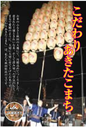
こだわりあきたこまち

A こだわり米を中心として 卸・実需者が求める米生 産や、播種前・収穫前契約により 米価の価格引上げを目指してい ます。