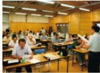
講師の説明に耳を傾ける参加者

一方、同大学の小林由喜也教授からは、大学で昨年栽培した菜の花の播種量、間隔などのデータを例に説明。「問題は条間で、広いと春先雑草が出やすい。11月下旬までに株の直径が30cm以上あれば、雑草は防げるが、そこまで大