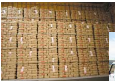
倉庫に集荷された米

Q JAでは大豆の団地化を 進めているが、適さない 圃場へも作付けしている状況なの で、適地への作付けを指導してほし い。乾燥機等の大豆機械、および 保管施設は面積にあった台数にし てほしい。