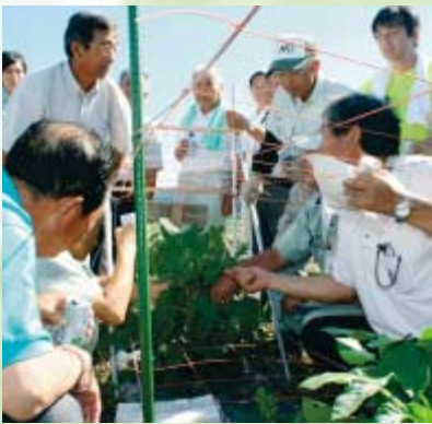
参加者自らアドバイスするなど活発な意見交換が行われた（種沢ファーム圃場）

下新城長岡地区の「長岡営農組合」では、大豆の連作障害対策として取り組んでいるヘアリーベッチ（緑肥）の圃場を見学しました。播種後の降雨が少なく、発芽が遅れたため、生育量の不足が心配されましたが、その後の好天にも恵まれ、順調に生育していることを参加者にも確認してもらったことができた。