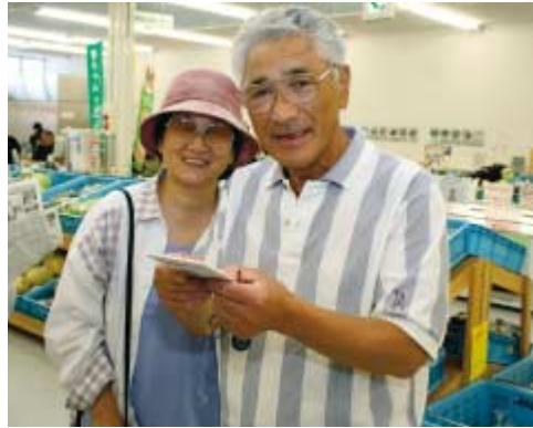
見事1等を当てて、ニコリ