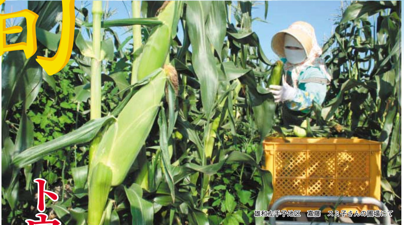
雄和左手子地区 嘉藤 スミ子さんの圃場にて