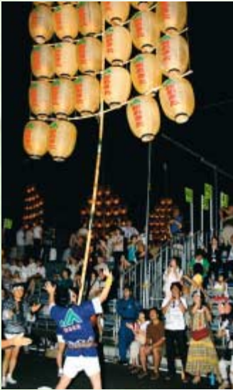
新あきた職員が差し手となり妙技を披露

東北の三大祭りの1つ「竿燈まつり」が8月3日（日）から6日（水）まで開催され、柳町町内会の協力を得て、JA新あきたも参加しました。