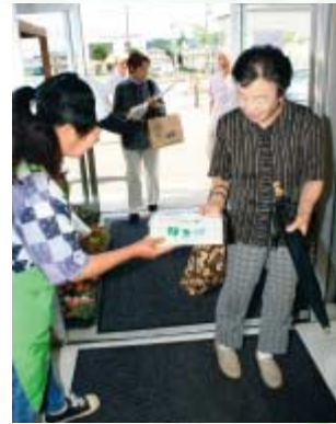
生産者が入り口でエコバッグの配布を行った