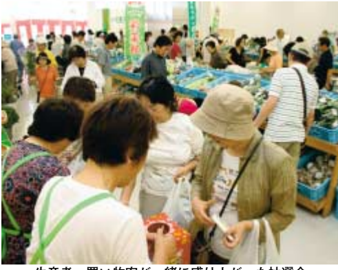
生産者、買い物客と一緒に盛り上がった抽選会