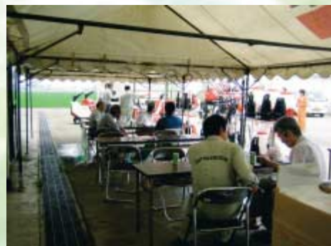
担当者と相談する生産者

これから農繁期に入りますが、農機具の故障や新調などの相談がありましたら、気軽に農機センターにお問い合わせください。