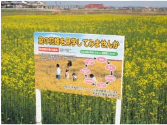
菜の花が満開した圃場（仁井田地区）