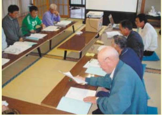
6月16日 追分支店会場（中野上公民館）

6月2日から25日の期間、管内各支部で開催した「支部座談会」には、組合員1、913人の皆様から出席していただき、JA事業に関する様々なご意見やご要望をいただきました。今月の特集では、支部座談会の主な内容を紹介しましょう。