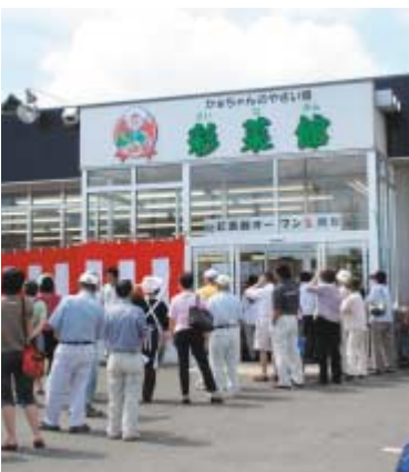
5周年記念イベントの様子

現在も設置に向け、行政と協議を継続しております。本年は調査費が予算計上され、今後は2号店の形態や、マーケットリサーチ等についての調査・研究を進め、早期設置を検討してまいります。