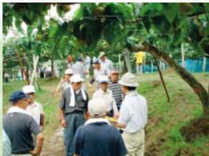
傾斜地の園地を視察する参加者

果樹試験場研究員から今後の管理のポイントや、県のオリジナル品種「秋泉」の説明があり、「特性や特徴を掴んでから、1本からでも試作してほしい」と参加者に呼びかけていました。