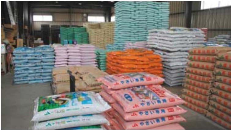
南営農センター 資材倉庫

肥料工場の製造端境期に入り、品薄であったことに加え、安価な肥料に注文が集中したことから在庫切れとなりました。今後は適時適正在庫の確保と、的確な情報収集、及びその提供に努めてまいります。