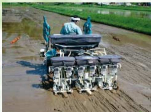
播種作業を行う生産者