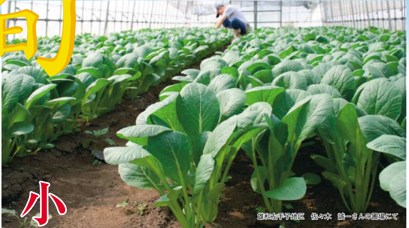
雄和左子地区 佐々木 誠一さんの圃場にて