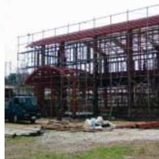
建設を進める西支店、営農センター