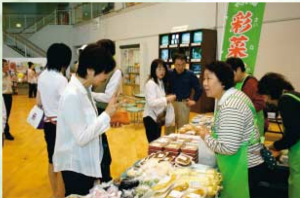
ふれあい加工所のメンバーが自ら店頭に立ってPR

今回は野菜、花、山菜、加工品を販売。飯島ふれあい加工所の会員や、JA職員が店頭に立ち、加工品に関する知識や調理法、美味しさなどを紹介し、会場は多くの来場者で賑わっていました。