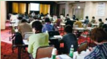
資料を見ながら熱心に講義を受ける女性部員

かがやき女性塾では、農業や食、生活設計などの幅広いテーマで年5回の講義を行います。