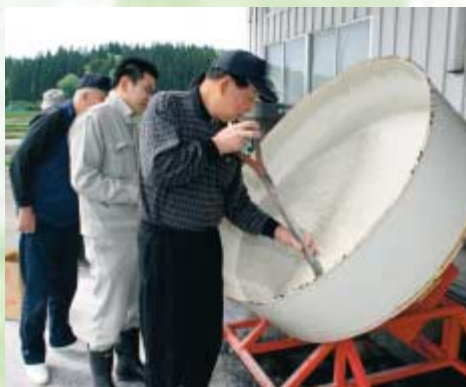
種子のカルパーコーティング作業

会員をはじめ、営農指導員ら7人が参加し、種子が団子状にならないよう水を加減しながら次々とカルパーを投入しました。コーティング終了後、落下してくる種子をすくい乾燥させ、12、