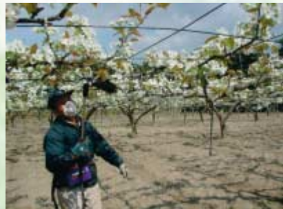
人工受粉を行う生産者

下新城野地区では主に幸水を栽培。幸水は、盆前に出荷ピークを迎え、県内外の量販店に出荷予定です。