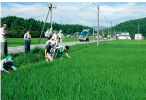
現地研修会の様子